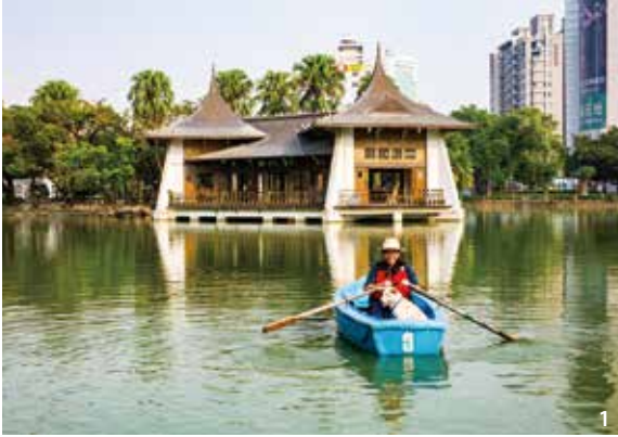
1&2.中部7縣市不僅環境優美也有越來越多特色店家值得一遊，透過聯合行銷不僅能達到客源分流，也能讓臺灣之美更廣泛的被看見。