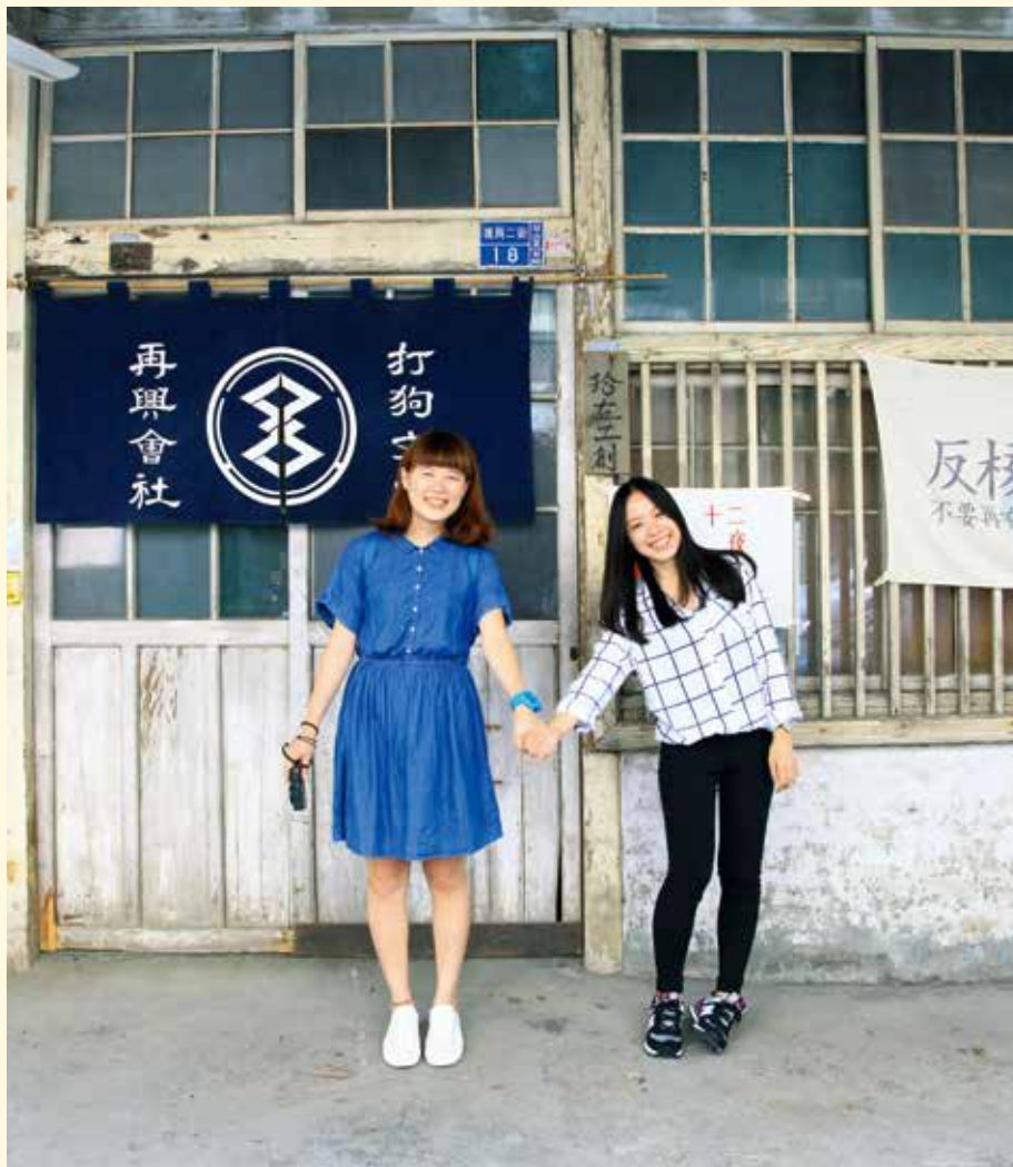
今年ITF主題為「牽手去旅行」，希望大家歡樂出遊共創美好回憶。

台 北國際旅展 (Taipei International Travel Fair; ITF) 自1986年開辦，今年將舉辦第24屆、邁入第30週年，已成為亞太地區人氣最高、全臺規模最大的展銷合一及國際知名展覽，展售內容涵蓋Outbound與Inbound旅遊產品，參與單位及觀展人數迭創新高，2015共有60個國家、950個單位參與，1,450個攤位在4天展期內吸引34萬8,270人次參觀。展覽期間創造的交易商機逾新台幣20億元，媒體報導露出逾4000則。