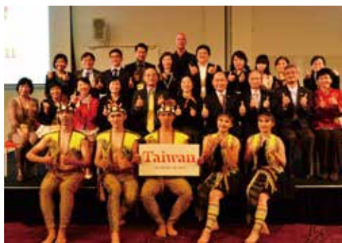
臺灣觀光代表團大合照。

間，也期使藉由當地媒體報導，增加臺灣曝光率，促使澳洲民眾將臺灣列為旅遊目的地。推廣會期間，野舞台舞團融合臺灣傳統文化元素、舞獅及客家美食於舞碼中，展現臺灣多元熱情文化。 ●