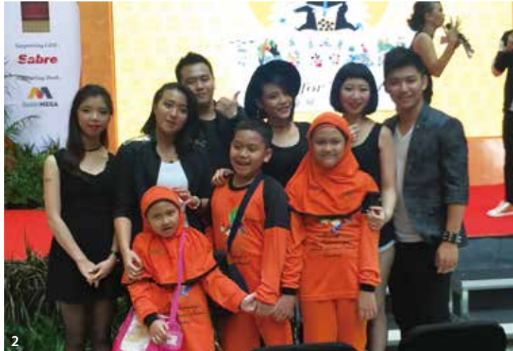
1&3.臺灣需積極培養導遊及東南亞語人才，讓新南向政策順利開展 2.9/1起對印尼開放有條件免簽，積極爭取印尼旅遊市場及穆斯林旅客。

對於政府推動新南向政策，賀陳旦部長表示，政府應針對問題找出解方、開啟新機會。雖然目前陸客持續減少，會導致部分收入減少，但是整體來臺旅遊人數還是有機會