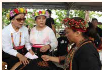
1&3.南島文化節 2.VAF阿卡貝拉音樂盛會