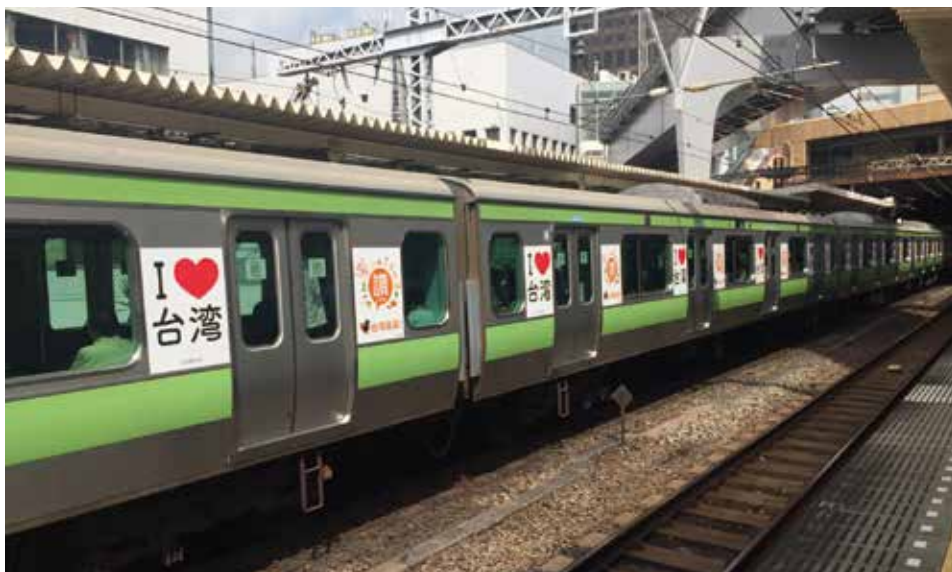
山手線列車外觀有明顯的「我愛台灣」字樣十分吸睛，令人留下深刻印象。

為行銷臺灣觀光，交通部觀光局在日本山手線推出一列臺灣觀光彩繪列車，並邀請中華、長榮、復興、台灣虎航等四家國籍航空，以及HIS、日本旅行、阪急、DeNA、樂天、KNT近畿日本ツーリスト(Kinki Nippon Tourist)、JTBワールドバケーションズ(JTB World Vacations)等七家日本在地旅行社共同攜手合作，包裝臺灣觀光形象專列，並播放臺灣觀光宣傳廣告，透過日本民眾熟悉的九份、天燈、芒果冰、小籠包、茗茶、台北101，並加入日月潭自行車道、臺東蘭嶼原住民獨木舟、澎湖古厝等融合美食、文化、樂活等新元素，邀請日本民眾一同搭山手線旅行臺灣。