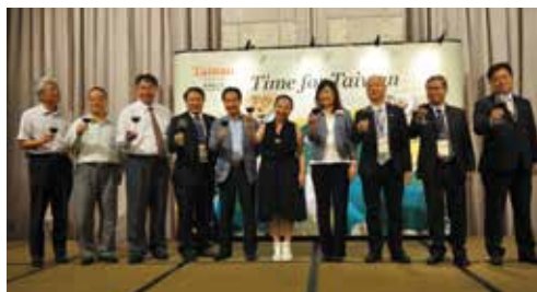
臺灣觀光代表團赴越南宣傳臺灣觀光特色並以多元活動展現臺灣活力。

為推廣政府「新南向政策」，臺灣自104年11月起實施「觀宏專案」簡化申請簽證措施，便利越南旅客來臺觀光。2016年1-8月越南來臺旅客數較去年同期成長17.3%，足見越南出境旅遊市場深具潛力。