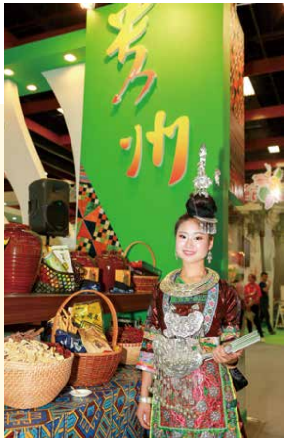
貴州展現濃濃的苗族民族風，除了美食更有精彩表演。

此外，食器也是襯托美食不可缺的元素。在「食之器」展區，文化部以「食藝術」為核心概念，結合所轄之博物館及多個交通部觀光局的國家風景區管理處展出食器的歷史演變及臺灣頂級工藝，並邀請工藝家與業者現場展售精緻食器。另外，以促進健康、潔淨安心為出發點的臺灣製鑄鐵鍋、壺、以及以引發太空科技變技的鈦金屬所製成的食器等都一一於美食展現場呈現，確實將實用與藝術結合，提升國人生活品質。