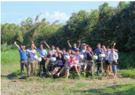
旅客與新屋愛鄉協會一同製作福求花。

本次桃園地景藝術節沿著海岸線漫遊新屋沿岸風光及裝置藝術，走進社區體驗社區生活，邀請藝術家進駐工廠創作，悠遊八