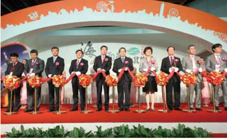
海峽兩岸臺北旅展行銷兩岸旅遊產品十分成功，促進兩岸交流。

9. 宗教朝聖： 從2000多年前，大陸便誕生了宗教。儒、道、佛等眾多宗教派別在中華大地上遍地開花，供海內外廣大中華兒女的朝拜瞻仰。