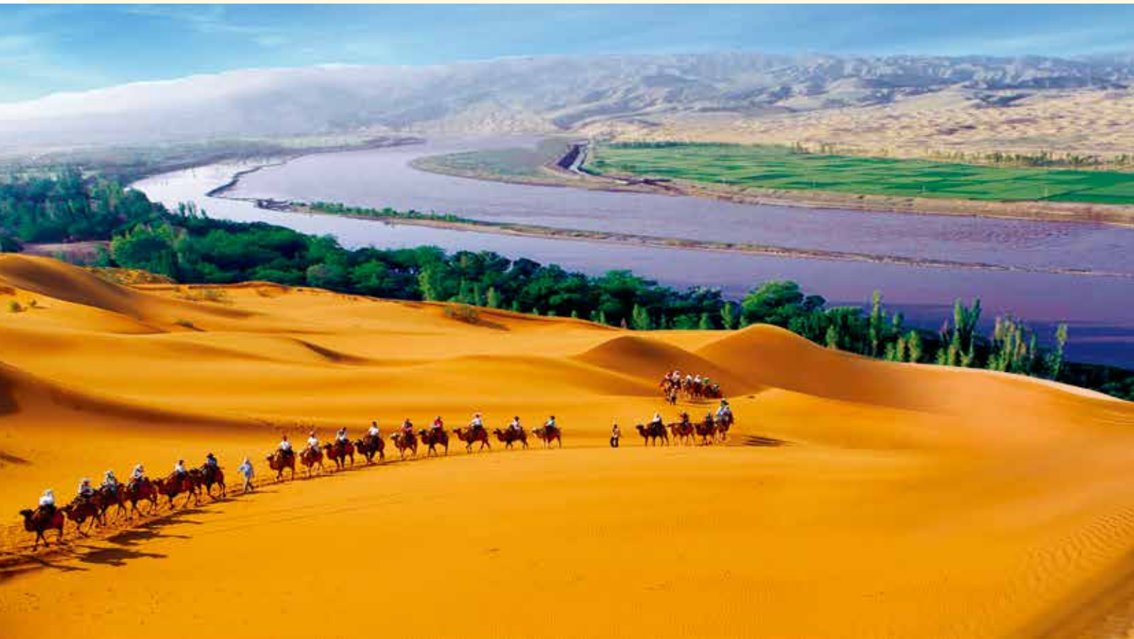
寧夏·沙坡頭的浩瀚景緻。

自 2005年開展的海峽兩岸台北旅展，開展後年年舉辦，今年將舉辦第11屆，對促進臺灣民眾了解大陸旅遊資源作出具體貢獻。海峽兩岸台北旅展於去年邁入第十屆，大陸展區有29個省區市旅遊協會，加上新疆生產建設兵團以及中國國際航空、東方航空等共33個單位參展、參展人數達820人。臺灣展區部分，旅行社增加到19家，再加上昇恆昌免稅店以及各大主題遊樂園，共有33個單位共襄盛舉。在大會規畫的慶祝活動和參展單位精采展出下，四天展期共吸引超過34萬參觀民眾，總銷售額突破2億，兩項紀錄均創歷史新高，成功行銷兩岸旅遊產品，促進交流。