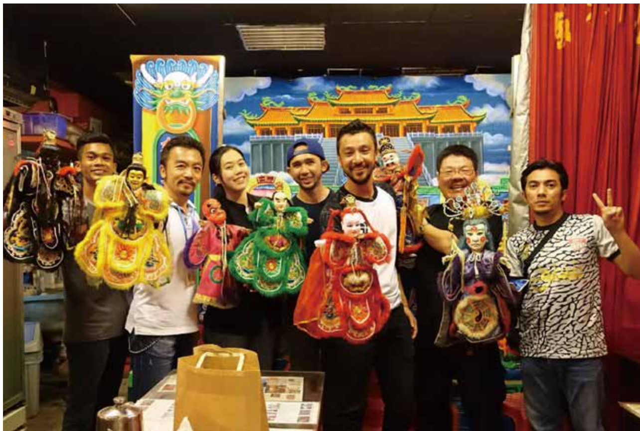
2016馬來西亞穆斯林拍攝隊The Streets 2

交通部觀光局統計，今（105）年1月至7月整體來臺旅客達628萬0,372人次，較104年同期成長7.93%，各主要市場均呈現正成長，其中，仍以近年成長幅度最大的韓國市場持續大幅成長29.01%最高；其次為日本市場成長17.46%及馬來西亞成長8.01%；港澳及歐美則成長約7%。扣除中國大陸之其他國際旅客，每月均成長一至二成，累計1月至7月計達387萬837人次，成長率達13.21%；而中國大陸旅客自今年5月份以來呈負成長，其中以觀光團旅客縮減三成，而自由行旅客每月成長約1成，成長力道相對不足，累計1月至7月微幅成長0.41%；整體來臺市場在其他國際旅客持續正成長加溫下，仍能維持穩定正成長。在政府持續推動大陸市場拓展計畫及觀光新南向方案等作為下，預估今年來臺旅客仍可突破千萬人次。