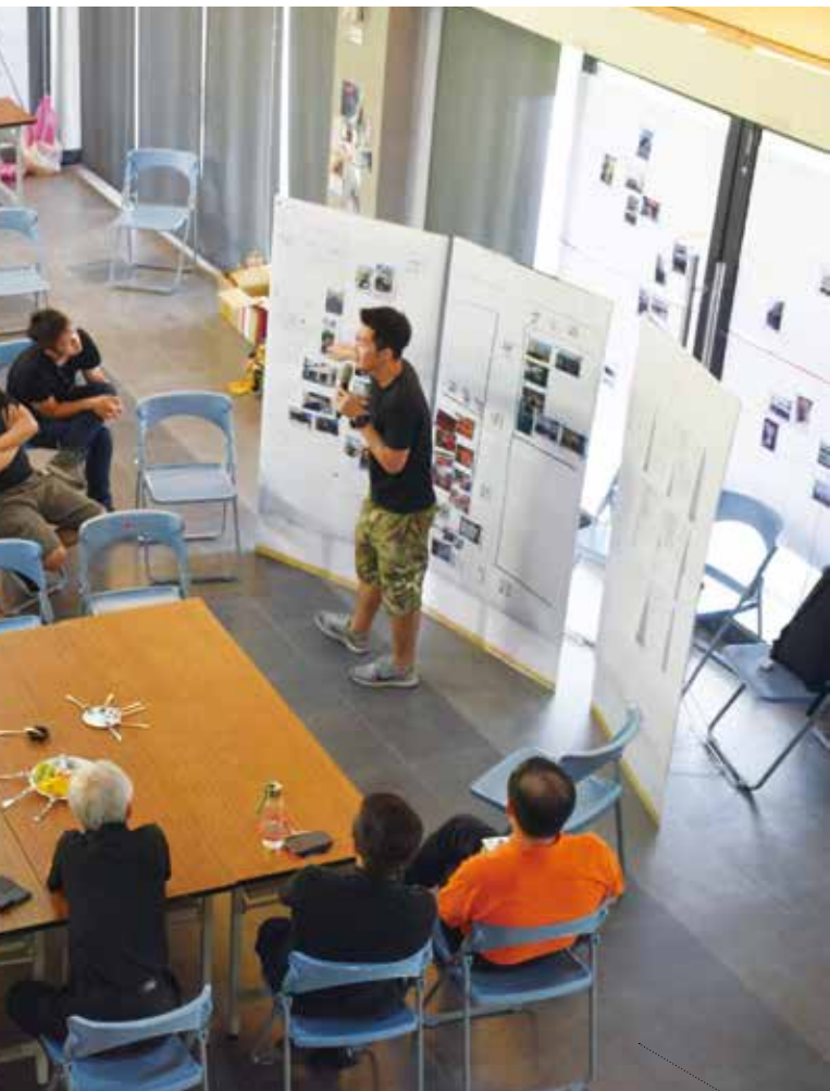
臺東縣政府舉辦「小招牌大景觀」第一場設計研習工作坊，激盪創意。

講座與工作坊，促進外來與在地設計師充分交流、培力在地設計、廣告業者，並診斷、解決現有設計問題，由彼此經驗分享，激盪對臺東未來整體街道景觀發展的設計準則。藉風災重建機會，用內外部資源及人才，提昇招牌公共安全、美化市容，進一步促進外地遊客觀光意願。