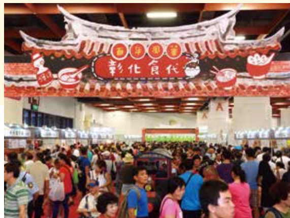
2016台灣美食展之彰化小吃街熱鬧非凡。

2016台灣美食展規畫用心，處處是亮點，展現出臺灣美食從產地到餐桌，都有展演的場域，成功彰顯出臺灣美食王國的品牌。2017年台灣美食展已訂於7月21日到24日於台北世貿一館舉行，相信又將會是另一場精采絕倫的美好盛會。