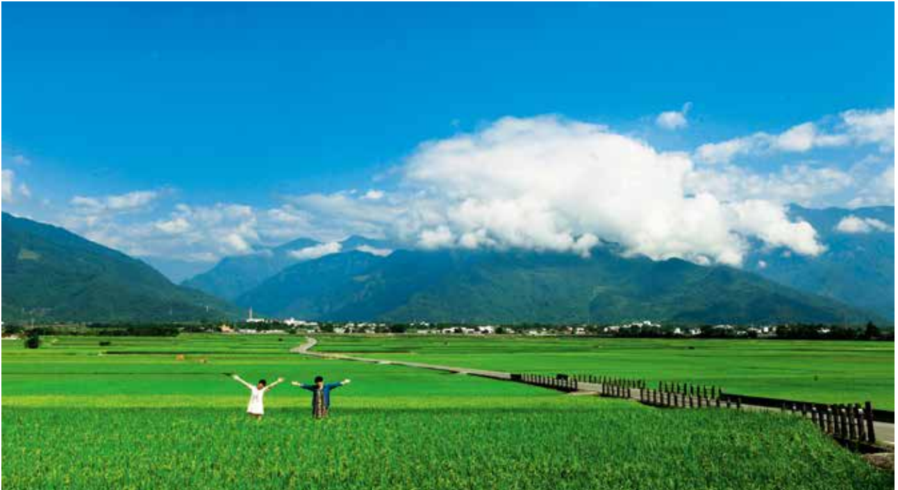
急進與過度的交通建設容易破壞臺灣原有的優美風景。

盤點及維繫自我資源再進而發揚光大，其地方獨特性更能吸引外國旅客，達到真正的「越在地，越國際」。圖為宜蘭如詩如畫的玉蘭茶園。