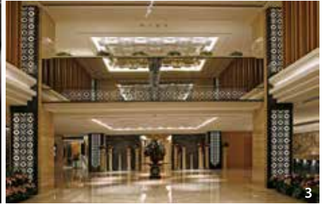
1.台中長榮桂冠酒店提供如家人般的細膩服務，女性住客備感安心，圖為標準樓層之豪華客房 2.旅遊時選擇合法旅宿才能玩得開心又安全 3.入住台北福容大飯店時於臉書打卡標註「福容大飯店台北」並「#登記字號」，完成後即可享每人迎賓飲料乙杯。