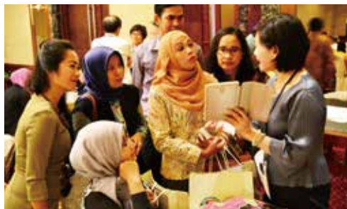
臺灣代表團團員為當地穆斯林業者解說台灣行程。

為持續推廣臺灣觀光，並宣導「新南向政策」及104年11月起實施「觀宏專案」對印尼簡化申請簽證措施，本次推廣活動由交通部觀光局委託台灣觀光協會組團，前往印尼泗水及棉蘭，讓印尼業者與媒體瞭解臺灣最新觀光資訊，並與當