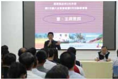
縣府擴大主管會報，黃縣長指示加強國際宣傳工作，做好在地接待工作。