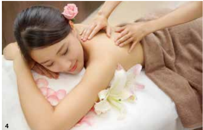
3.臺灣小吃不僅選擇多，熱鬧的氛圍也令旅客印象深刻 4.SPA、芳療等可舒緩身心活動近兩年來也很受觀光客喜愛。

勢，觀光局也協助旅遊業者加強開發來臺自由行旅遊商品，並持續協助旅遊團體赴臺觀光及深化自由行市場宣傳，期吸引更多新加坡旅客重遊來臺。