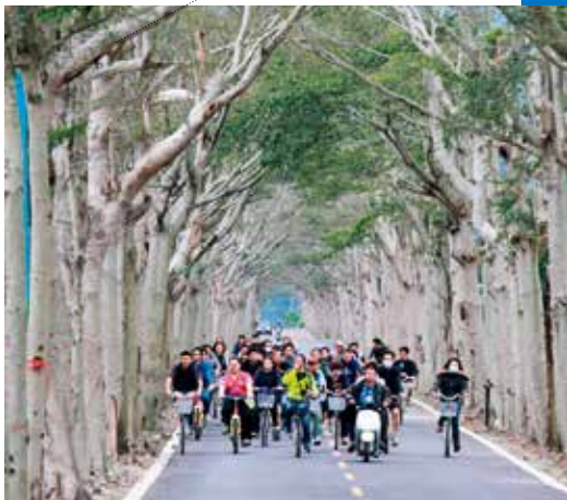
台灣好玩卡針對臺東運動觀光推出自行車套裝遊程。