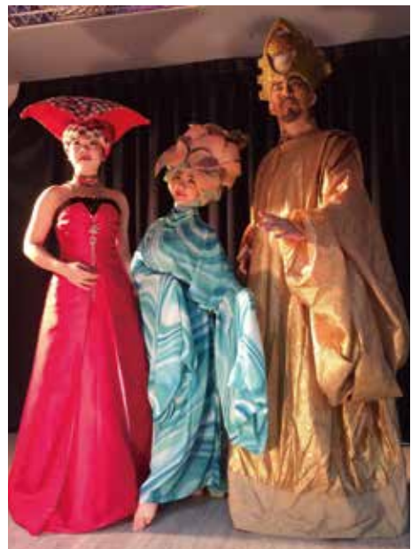
環境劇場——戀戀八塊厝中張忘老師所設計的精靈造型

八德區以陂塘為景，與居民共同創作，讓在地人演出在地故事。透過戲劇演譯的方式，從先民開墾陂塘引水灌溉開始講起，運用「人界」與「陂塘精靈界」的愛情故事，呈現八德地區從農業邁入經