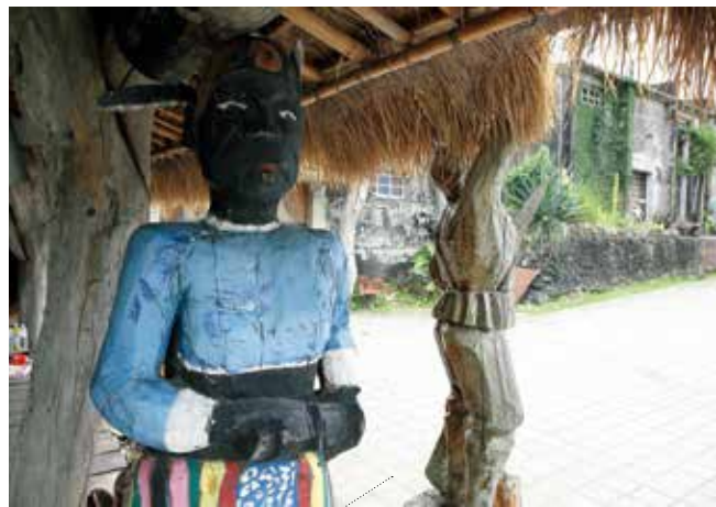
原住民的多元文化及運動觀光皆是目前臺東縣政府的推廣主題。

本次於檳城G Hotel舉辦的推廣會，向旅遊、媒體及相關業者推薦臺東優質旅遊行程，展現臺東多元觀光特色，以往來臺大馬遊客多留在西北部，普遍對於故宮、烏來、野柳、太魯閣以及臺灣人的熱情反應良好。臺東對大馬遊客而言算是個嶄新的景點，其南島文化和