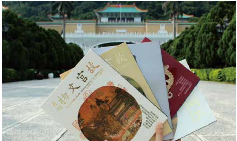
《故宮文物月刊》每期精選文物薈萃，絕版17~63期僅在臺中銷售。

國立故宮博物院自今年7月首推「故宮曬書節」活動，截至8月底已瘋狂銷出8萬多本出版品。為與中部地區民眾分享好康，故宮於9月13日到10月16日在臺中文創園區拾藝術B棟舉辦「故宮月—台中曬書節」活動。故宮表示，臺中場比臺北規模大5倍以上，活動免費入場，除了獨家釋出《故宮文物月刊》早期的絕版期數，還結合寶可夢話題，只要在現場拍下神奇寶貝與故宮活動看板同時出現的手機畫面，打卡上傳FB，即可獲得故宮文創贈品。