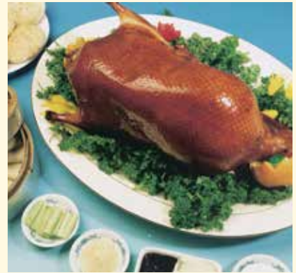
中華美食名揚海外，北京烤鴨更是其中一道享譽盛名的料理。

1. 高鐵旅遊： 隨著多條高鐵線路的陸續開通，大陸的高鐵交通體系已相當綿密、完善，使得廣大遊客出遊更加舒適、便捷，乘坐高鐵旅遊已成為目前大陸新興的出遊常態，也帶動旅遊產業及整體經濟發展。