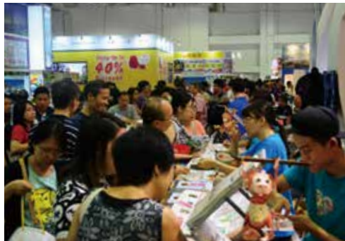
新加坡民眾駐足臺灣館，積極詢問旅遊資訊。

交通部觀光局委託台灣觀光協會辦理2016新加坡推廣活動號召100單位、159人團隊，包括縣市政府、飯店旅館、旅行社、休閒農場、主題遊樂園以及各觀光協會組織等相關業者前往新加坡行銷臺灣；推廣行