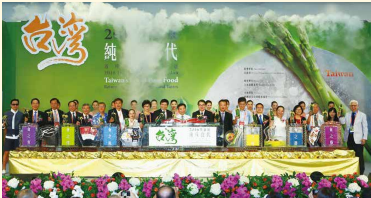
2016台灣美食展共吸引15萬4,797人次民眾參觀，再創歷史新高。

根 據觀光局對來臺國際旅客所做調查，美食一直是臺灣的觀光亮點及國際旅客來臺主要原因之一；CNN旅遊網的讀者2015年評選臺灣為「全球最佳美食旅遊地點」第一名，足見臺灣美食魅力滿點。