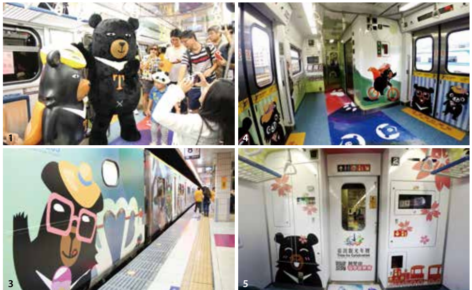
1. 喔熊組長不管走到哪兒都是鎂光燈焦點，深受喜愛 2&3&4. 列車由內至外都細心彩繪上喔熊組長的身影，讓搭乘列車這件事本身就充滿無比樂趣。

OhBear微笑觀光列車將於8月29日在樹林火車站舉行首航儀式後，未來將投入南部嘉義至屏東區間車運用任務，後續彩繪列車班次將公布於喔熊組長臉書粉絲團與臺鐵局網站。