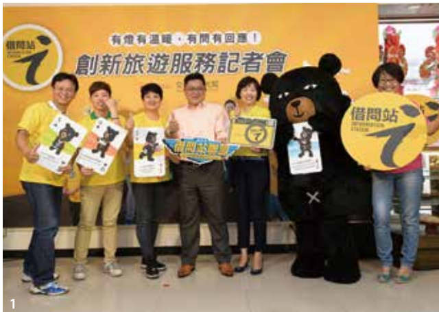
1&2.借問站結合了地方特色及當地人的熱情，帶給旅客們即時又暖心的服務。

而有鑑於自由行外國觀光客的增加，交通部觀光局特別推出多語版「借問站旅行撲克牌」，共有中英、中日、中韓、中馬（馬來文），由喔熊組長代言，提出13個旅客最常問的問題，讓借問站的精神展現在遊戲之中，感受到臺灣老闆們的禮貌與熱心，即使是不會講英文，也會很努力的想要幫助你（妳）喔！