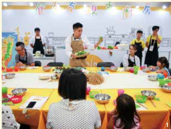
1.食之育之親子廚房帶領小朋友從小建立正確飲食觀念。 2.今年的國際廚藝邀請賽最終由臺灣隊與澳門隊爭奪冠軍頭銜。

今年由臺灣隊與澳門隊進入總決賽，比賽食材為甲魚、龍膽石斑、珍寶雞、臺灣牛、原住民小米、臺灣烏龍茶及臺灣咖啡等七樣，七樣都要入菜，最終由米其林一星主廚梁耀華率領的澳門隊以些微差距奪得第一名「特級金廚獎」榮譽，臺灣隊則獲得「金廚獎」肯定，雖敗猶榮，向國際媒體及其他優秀的國家代表等展現了臺灣的廚藝實力。