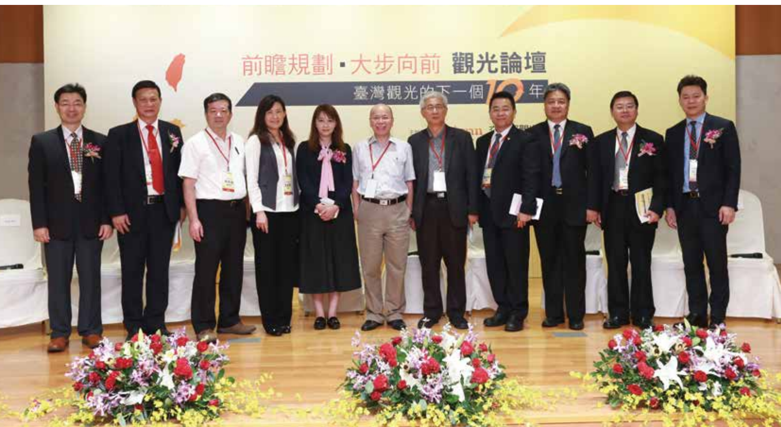
「前瞻規劃、大步向前」觀光論壇廣納觀光產、官、學各界對臺灣觀光發展之需求與建議。

新 南向政策涵蓋多個面向，行政院所提出的「新南向政策推動計畫」秉持「長期深耕、多元開展、雙向互惠」核心理念，預計整合各部會、地方政府，以及民間企業與團體的資源與力量，從「經貿合作」、「人才交流」、「資源共享」與「區域鏈結」四大面向著手，期望與東協、南亞及紐澳等國家，創造互利共贏的新合作模式，建立經濟共同體意識，其中又以「人才交流」及「資源共享」兩項與觀光產業有較密切的關係。