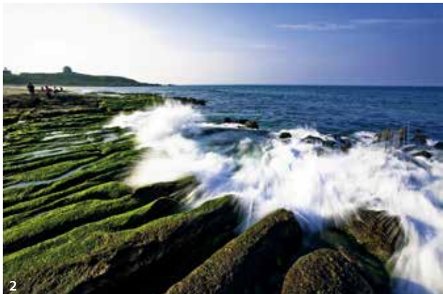
1.在木村拓哉明星魅力加乘之下，日本來臺旅客數已連續11個月呈正成長 2.北海岸、野柳等風光明媚的景點常聚集許多外國遊客。