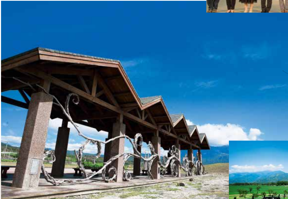
臺東擁有迷人的山海景觀，入選為2016亞洲10大旅遊景點。