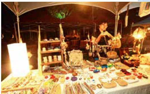
文創風十足的鐵花村受災嚴重，政府邀集旅行業者一同實地巡視。