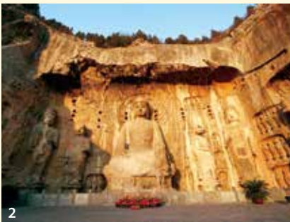
1. 長江三峽鬼斧神工，圖為巫峽沿岸的絕美風光 2. 龍門石窟被列為世界文化遺產，為中國石窟藝術寶庫。

2. 都市風情： 大陸經過幾十年的持續發展，經濟繁榮昌盛。上海、北京、廣州、深圳等一大批國際性的現代大都市，經濟發達，都市風情別具一格，城市風光秀麗。