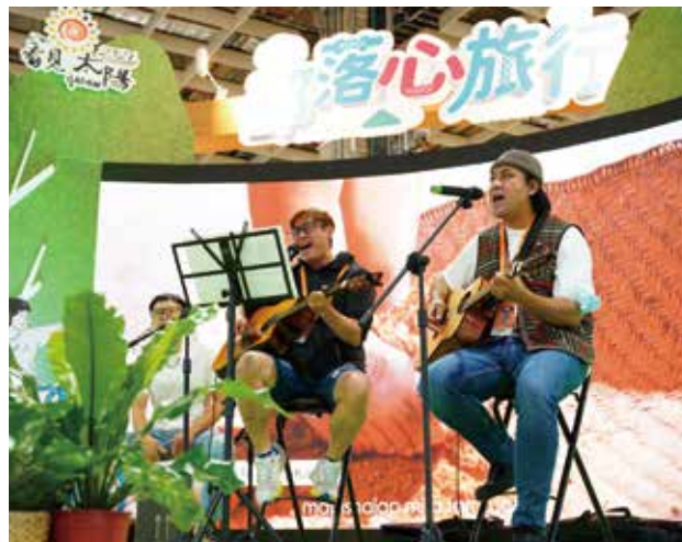
原住民會推部落旅遊路線，邀請民眾體驗原住民部落旅遊魅力。