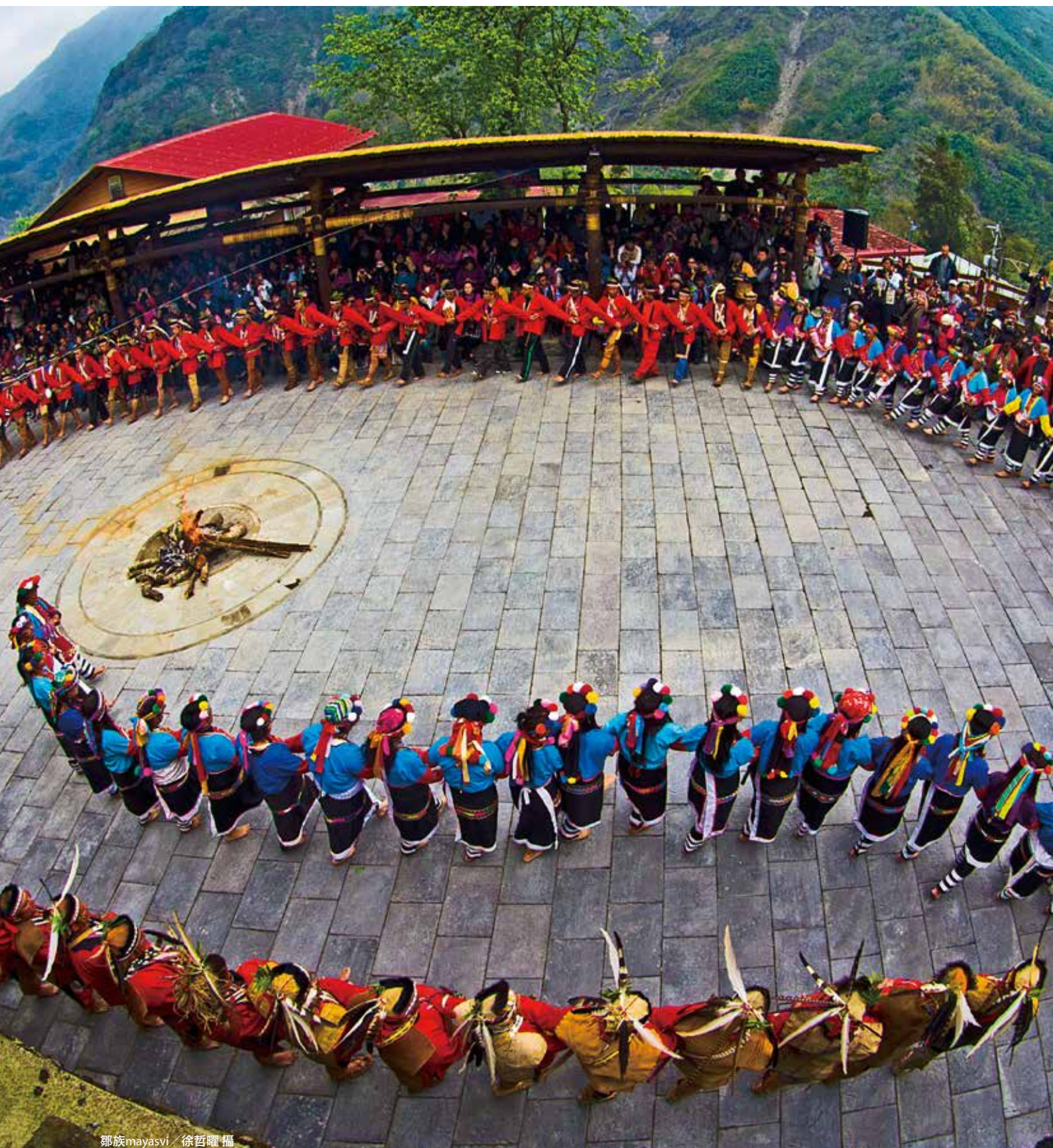
鄒族mayasvi / 徐哲曜攝