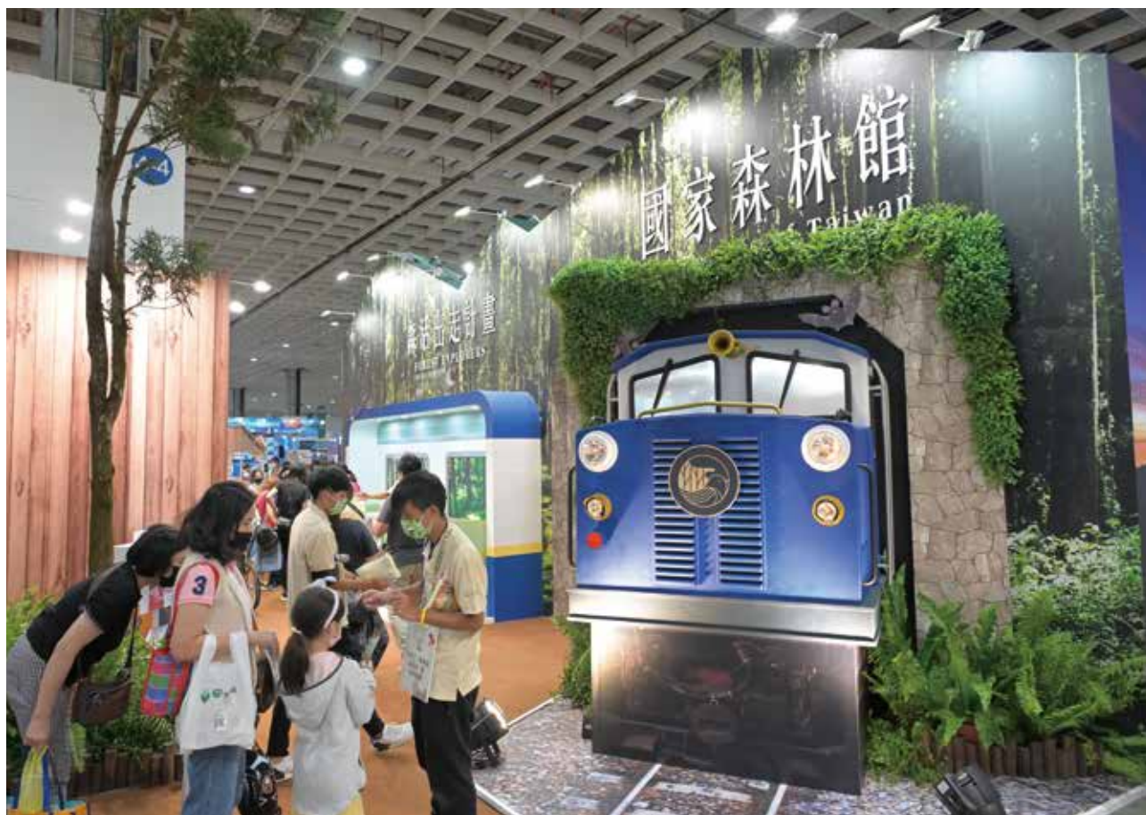
林務局往年以森林遊樂區結合周邊資源，盼更多都會民眾走入山林、愛惜山林。

ITF台北國際旅展就像探索秘境、環遊世界的遊樂場，您只要來到展場，絕對讓您逛不完且好康拿不完！