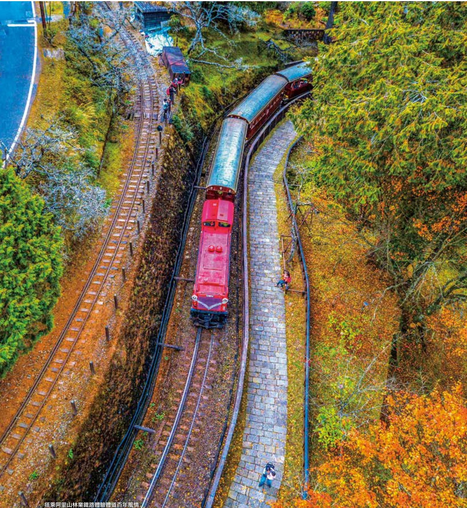
搭乘阿里山林業鐵路體驗體道百年風情