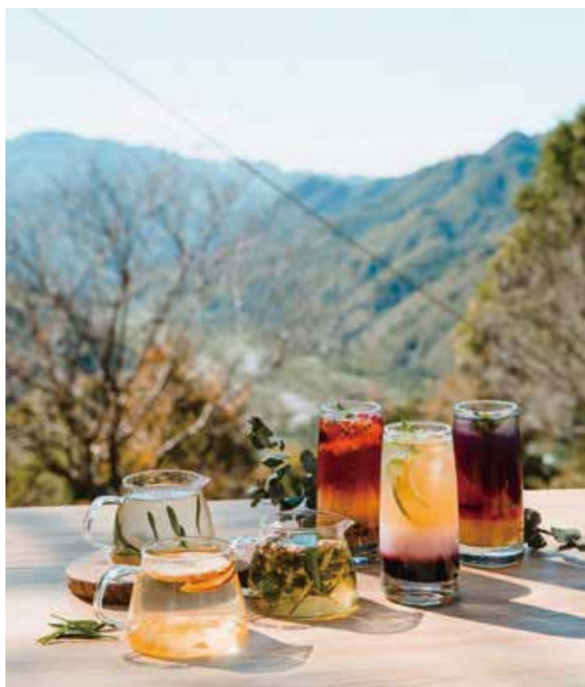
新竹薰衣草森林-紫色森林療癒慢遊_森の午茶