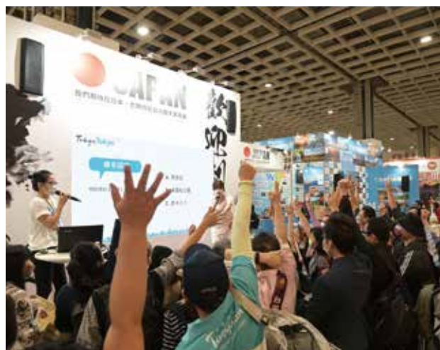
日本館每年皆大規模參展，現場有多個城市展攤，提供豐富的旅遊指南文宣、精美的紀念品，更以多樣化的互動遊戲活動受到許多民眾喜愛。