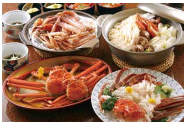
「福井縣」越前蟹 蟹肉料理界的精品