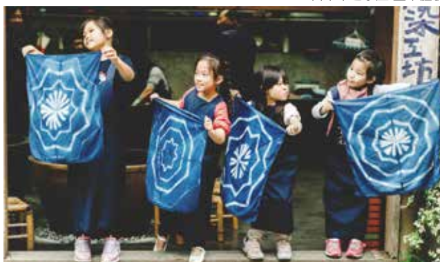
苗栗卓也小屋-藍染體驗