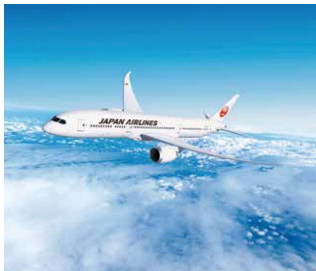
美好日本行就從踏入日航機內開始

福井縣位處日本的北陸地方，面向日本海，約90%的日本製眼鏡都來自福井。福井的精品越前蟹、鯖魚壽司、越前蕎麥麵鄉土料理都獨具特色；若狹塗、越前漆器等工藝榮獲經濟產業大臣指定為傳統工藝品。