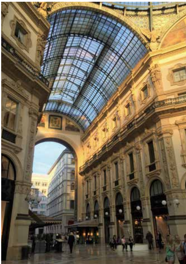
米蘭-艾曼紐二世拱廊