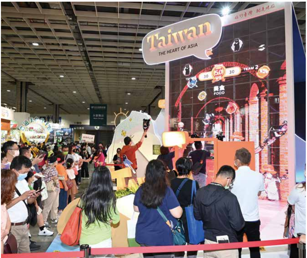
交通部觀光局台灣館，精心安排的台灣旅遊互動遊戲，充滿排隊欲體驗的人潮！