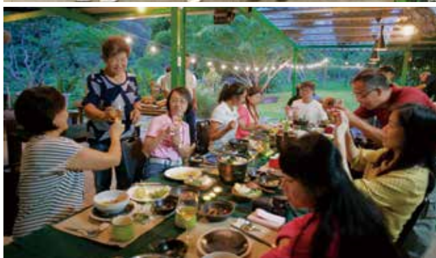
宜蘭頭城休閒農場-幸福島嶼農村食堂