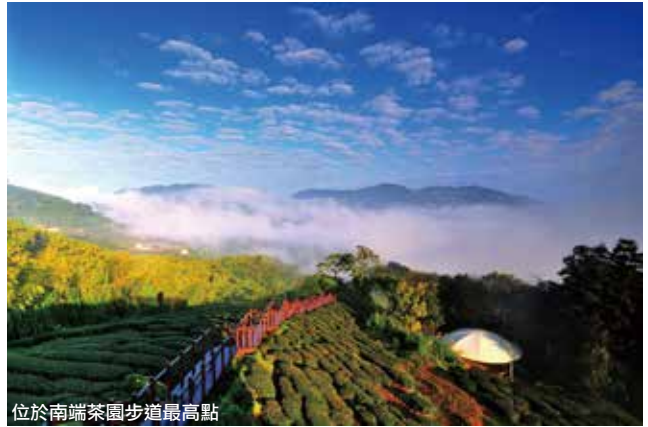
位於南端茶園步道最高點