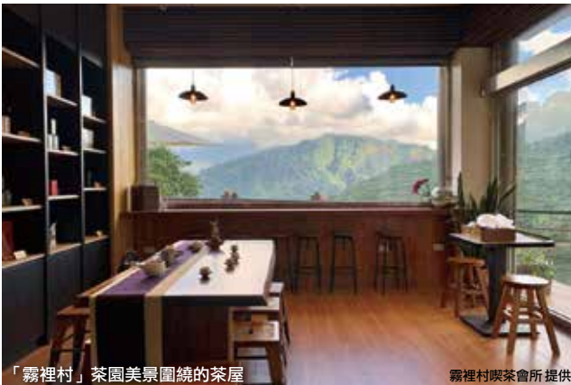
「霧裡村」茶園美景圍繞的茶屋