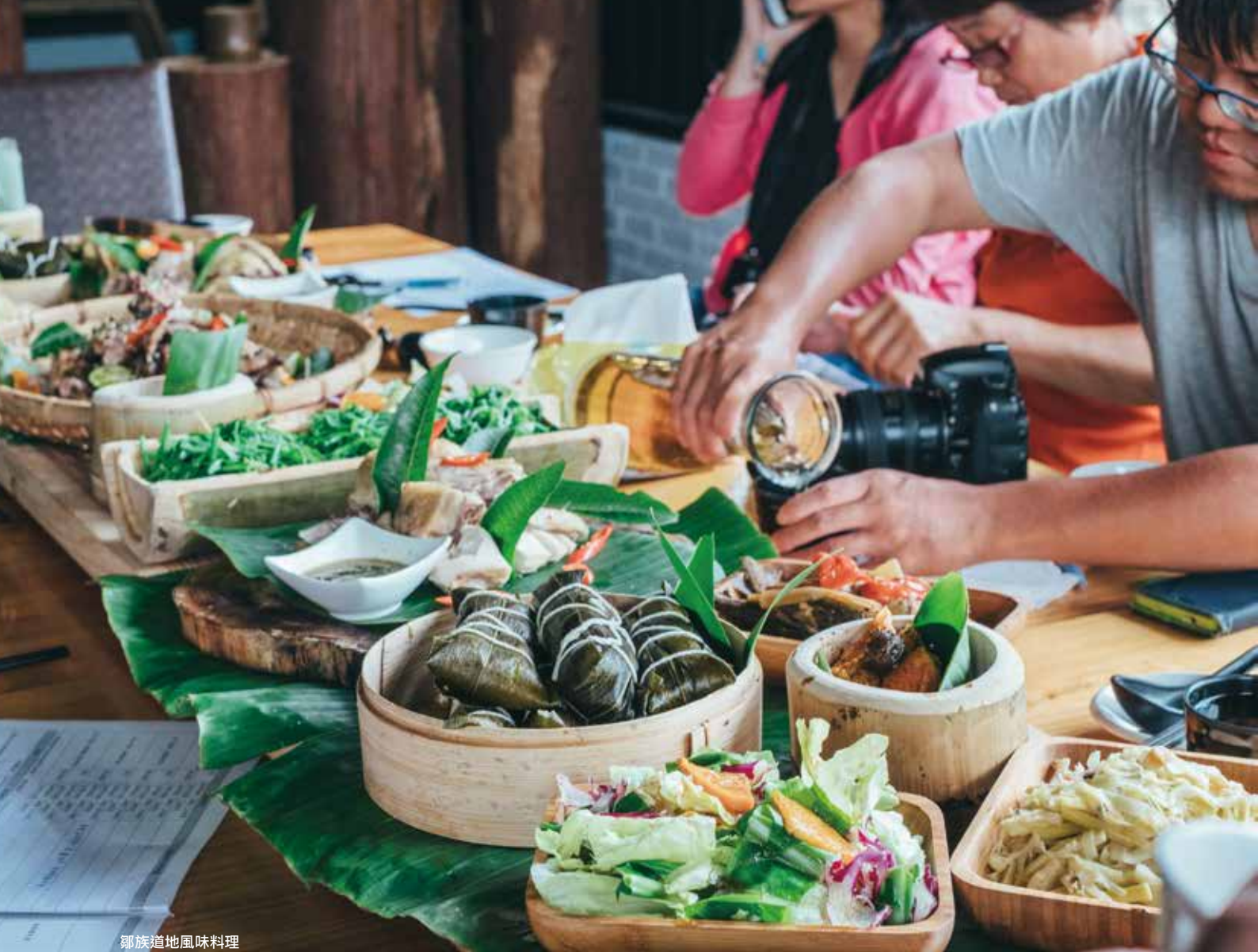
鄒族道地風味料理

宴，為一天豐沛行程畫下美好句點的最佳犒賞！「山芙蓉茶業」是一家以阿里山茶著稱的店家，但內行人也深知，這裡的鄒族風味料理總讓老饕讚不絕口、一訪再訪，善用當地蔬果、山菜等食材料理，有炒山菜、烤肉、樹豆湯、酥炸溪蝦…等鄒族傳統家常菜外，排灣族的老闆娘也會融入部分排灣族料理，享用美味菜色後，還能順便品一杯阿里山高山茶。晚上就回到樂野部落中心點的「慕噶納娜」民宿，入住由族人經營的民宿，體驗部落的夜晚與清晨，跟著族人一起在自然中感受部落山居日常。