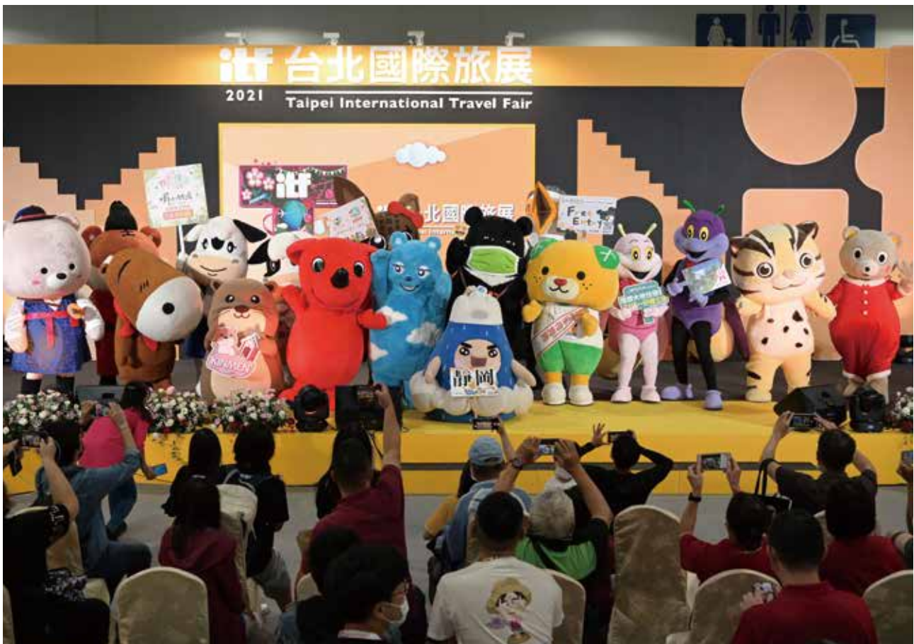
最受大朋友小朋友喜愛的「吉祥物大遊行」，一直是逛展民眾爭相合照的旅展重頭戲，歡迎大家一起來同歡！