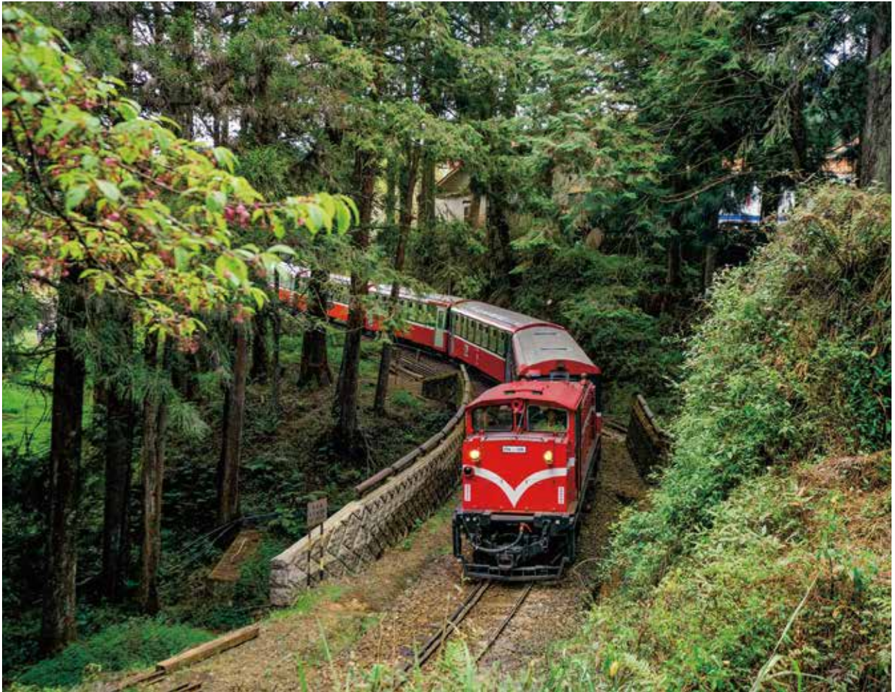
鐵道觀光-阿里山火車