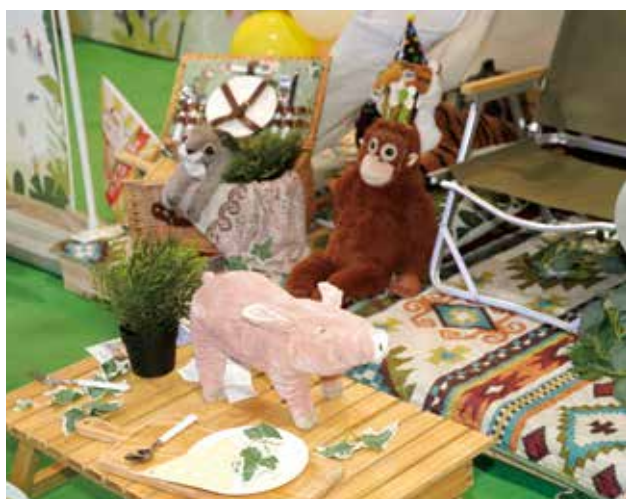
遊樂園在旅展期間不但能入手超值優惠，現場活動往往能得到精美小禮！