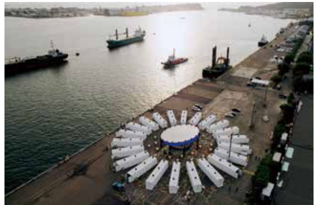
「台灣設計設計台灣X 22組台灣設計力」以壯觀的22只40呎貨櫃為載體，於設計中島上擺陣成圓。

「台灣X22組台灣設計力」最引人注目，以高雄港最常見的貨櫃22只，排列成圓的壯闊氣勢讓人驚嘆不已外，貨櫃內則由22組指標性策展團隊參展，涵蓋建築、平面、音樂、時尚、公益…等多種領域，難得齊聚一堂的夢幻名單共同詮釋台灣設計，絕對不容錯過！而入秋後的港灣涼風徐徐、舒適宜人，展出時間每逢假日更特別延長至晚上10點，透過特殊設計的夜間燈光氛圍加持，絕對適合白天、夜晚分不同時段來觀賞。