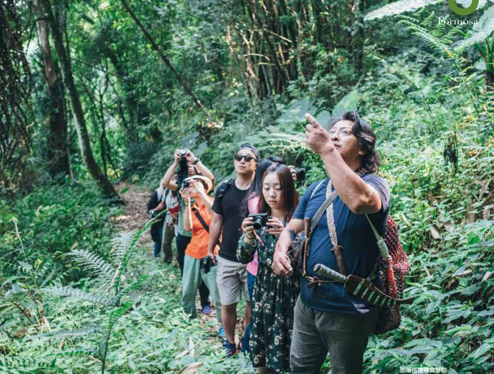
部落巡禮導覽解說

步道，偶爾駐足，聽風、看雲霧的變化，最後回到部落享用午餐，在位於民宿隔壁的「華納因厝」餐廳用餐。是由鄒族退休校長回部落經營的，除遊客外，也常見在地族人來訪寒暄、彈琴娛樂，是個充滿活力與趣味的鄒族人生活觀察站。用完午餐來到「優遊吧斯阿里山鄒族文化部落」，這裡也是部落的必訪之地。位在部落外圍被茶園及咖啡園環抱的園區內，廣達3公頃，以鄒族意象布置及傳統建築圍繞的園區中，包含有：鄒族文物哈莫文史館、瑪翡餐廳、茶屋、千年神木館、手工藝品中心等，矛達諾劇場每天上演2場鄒族傳統歌舞表演，更可以在此品嚐園區種植的競賽得獎咖啡和阿里山高山茶，將鄒族文化與產業體驗在此完美整合，成為鄒族文化初體驗者的最佳萬花筒。