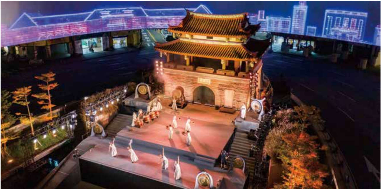
新竹光臨藝術節-優人神鼓戶外演出

今年將延續「文化帶路」為行銷主題，透過「場域、時代、族群、產業及生活」等五大面向梳理，結合獲選之旅行業者，於2022台北國際旅展文化部主題館，進行文化觀光遊程推廣。民眾能以展期限定價格，購買文化觀光精選遊程，現場也將規劃展館集章活動、DIY體驗及文化展演活動欣賞，搭配互動問答及精美禮品贈送，推廣各主題遊程文化亮點，提供民眾多樣化的旅遊選擇，歡迎大家展期間來文化館走走逛逛，感受文化觀光的深度與魅力。