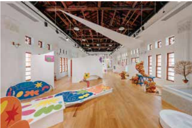
城市展區-原愛國婦人會館 展覽「美力年代」。