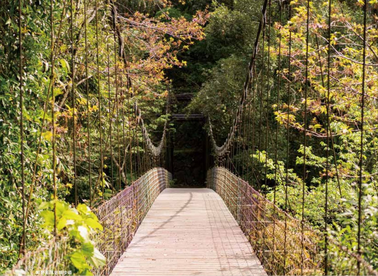
樂野部落迷糊步道