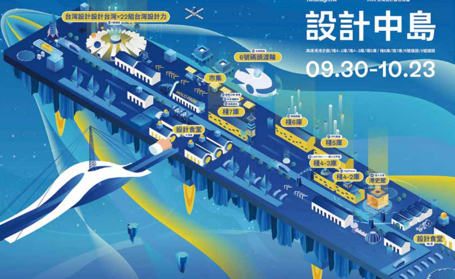
設計中島展區地圖