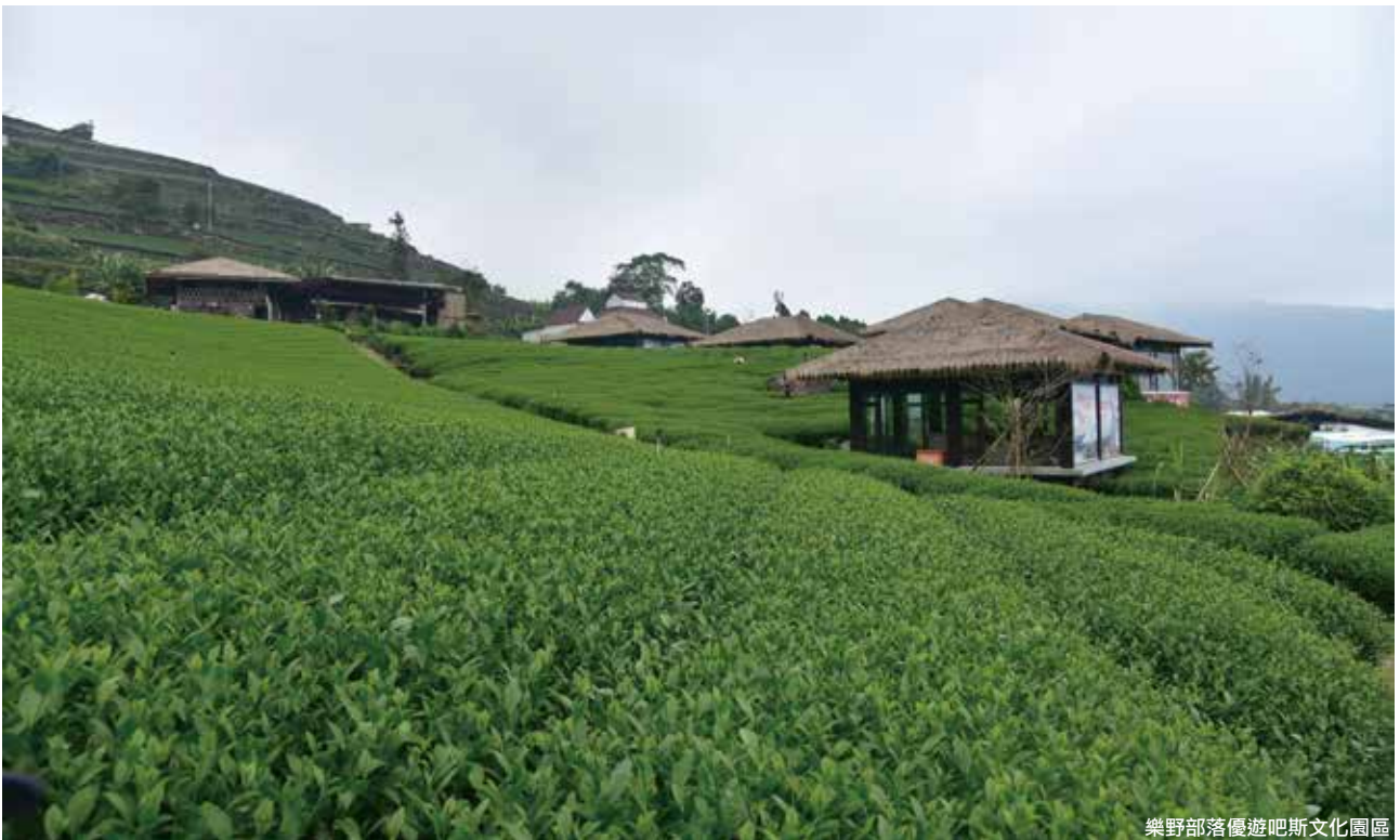
樂野部落優遊吧斯文化園區

活力早餐 ▶ 雅吾瑪斯步道 ▶ 午餐(華納因厝-部落料理與咖啡品嚐) ▶ 優遊吧斯園區鄒族文化部落體驗 ▶ 賦歸