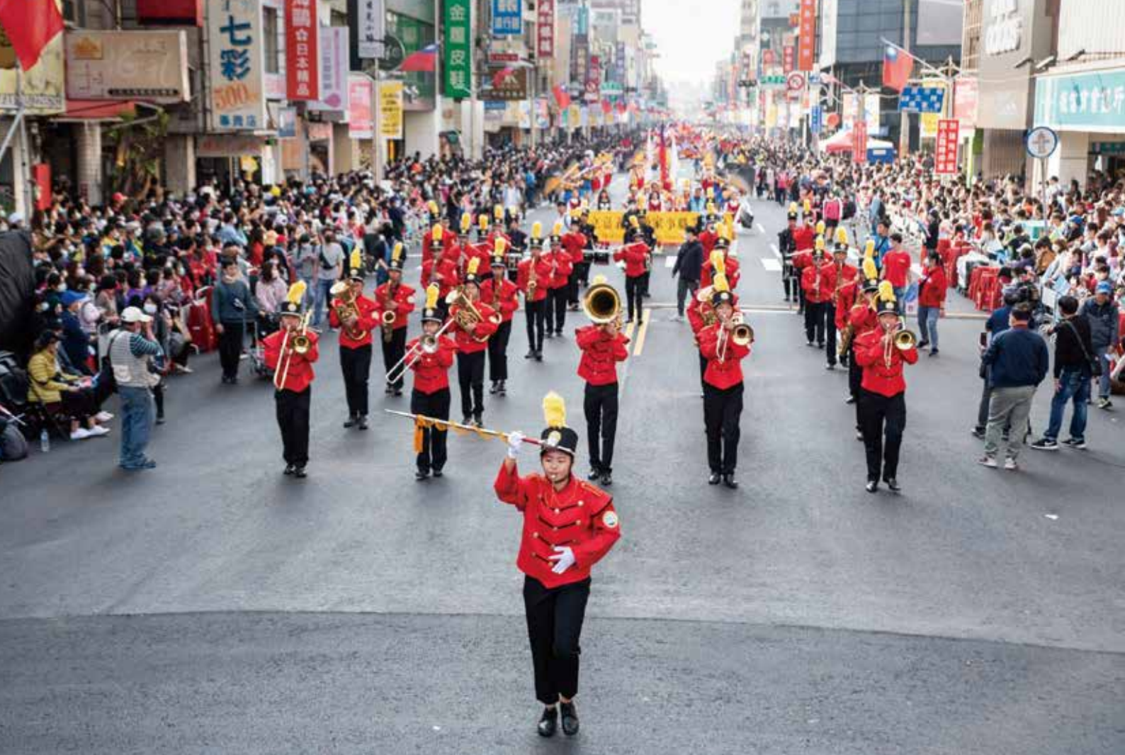
來自各地的管樂隊團體踩街遊行，為活動拉開熱鬧序幕。