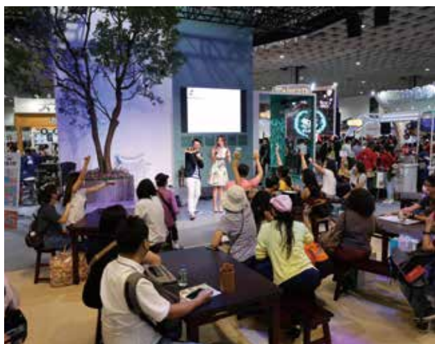
客家館往年安排特色表演與講座，讓觀展民眾親身體會客家文化的迷人之處。