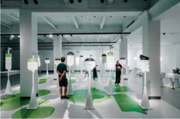
「登入大港」以設計詮釋高雄港前世今生與未來想像。