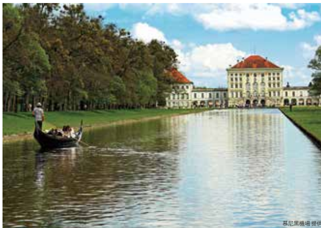
寧芬堡宮