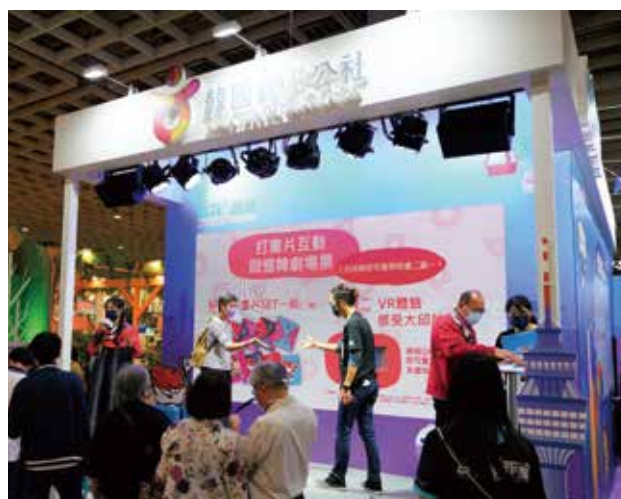
韓國館每年皆會規劃充滿驚喜的互動區和體驗區，讓民眾認識更多韓國景點。不知今年將以什麼主題邀大家一起來體驗呢，敬請期待！