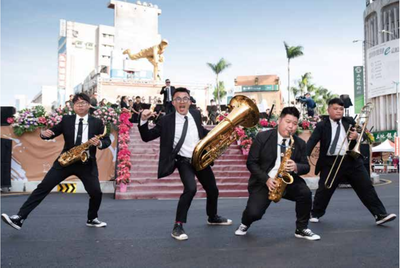
充滿活力創意的管樂演出，每年帶來不同音樂饗宴。