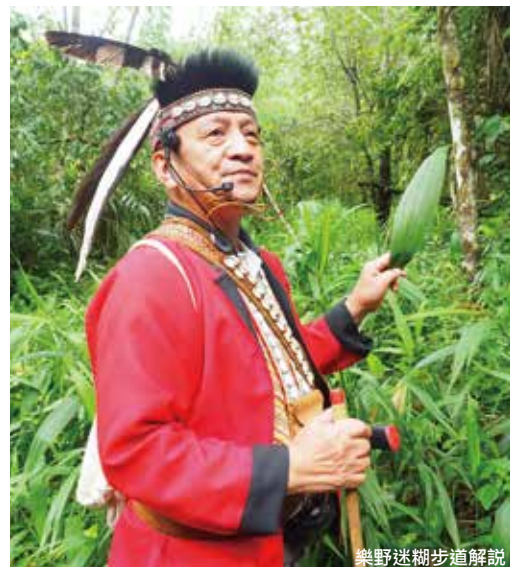
樂野迷糊步道解說

步道，偶爾駐足，聽風、看雲霧的變化，最後回到部落享用午餐，在位於民宿隔壁的「華納因厝」餐廳用餐。是由鄒族退休校長回部落經營的，除遊客外，也常見在地族人來訪寒暄、彈琴娛樂，是個充滿活力與趣味的鄒族人生活觀察站。用完午餐來到「優遊吧斯阿里山鄒族文化部落」，這裡也是部落的必訪之地。位在部落外圍被茶園及咖啡園環抱的園區內，廣達3公頃，以鄒族意象布置及傳統建築圍繞的園區中，包含有：鄒族文物哈莫文史館、瑪翡餐廳、茶屋、千年神木館、手工藝品中心等，矛達諾劇場每天上演2場鄒族傳統歌舞表演，更可以在此品嚐園區種植的競賽得獎咖啡和阿里山高山茶，將鄒族文化與產業體驗在此完美整合，成為鄒族文化初體驗者的最佳萬花筒。