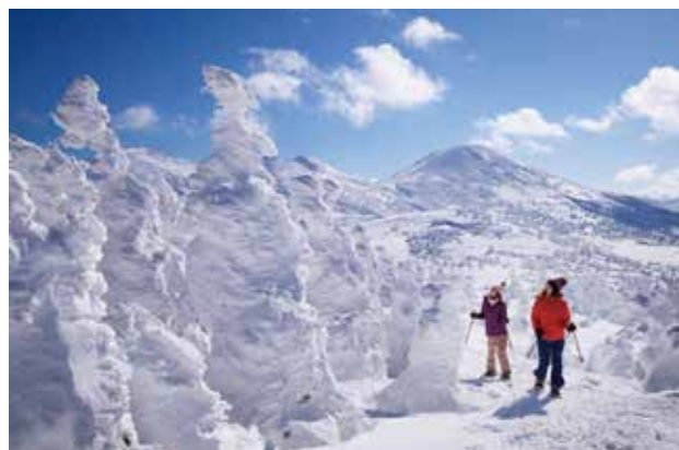
「青森縣」八甲田樹冰 日本東北三大樹冰聖地之一