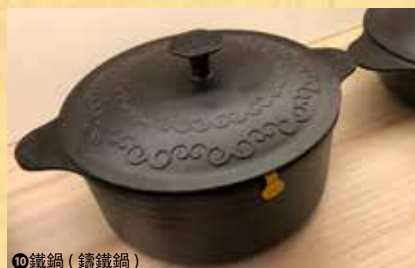
10 鐵鍋 (鑄鐵鍋)