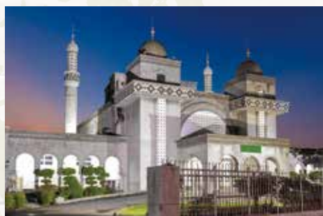
台北清真寺情境合照