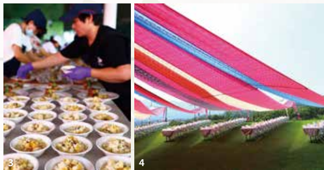
1&2&3&4.2019新加坡旅客在地餐桌體驗活動