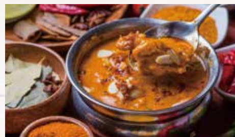
特級雞肉咖哩Chicken Shahi Korma