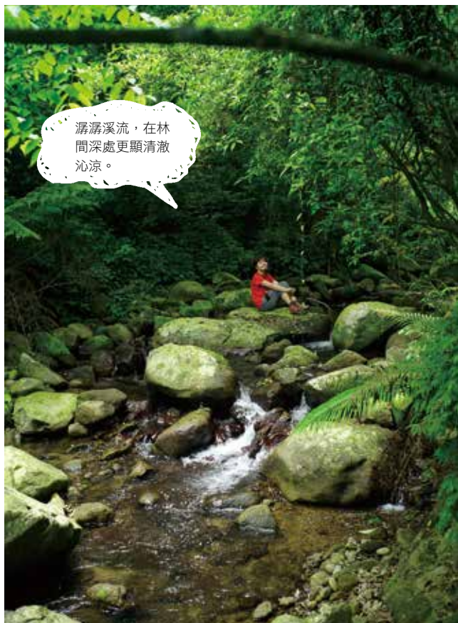
潺潺溪流，在林間深處更顯清澈沁涼。

我們前往這天是個平常日的上午，沿途居然沒有遇到任何其他健行者，也難怪路上經常遇到蜘蛛就這樣大咧咧地在通道的上方結網，沒留神的