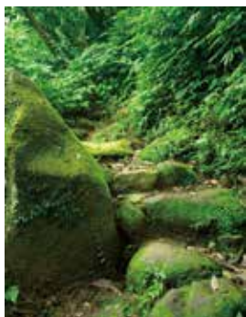
古道上偶有石橋作為通道。