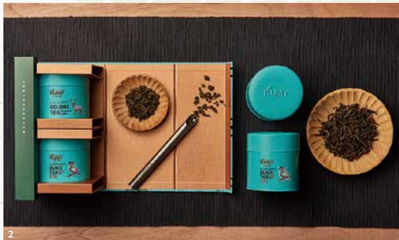
1.阿里棒棒-飛魚卵香腸。2.古邁茶園-茶葉。3.剛好冰果室-珍珠奶茶冰。4.預警讚冰店-芒果冰。