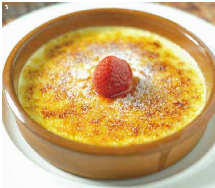
1.來自法國的食材搭配臺東生鮮農作，產生折衷的創意。2.Dulan Crap餐廳的隔壁也有一間小型藝廊。3.法國的香草、法國的奶油搭配上臺灣的糖，焦糖烤布蕾香濃自不待言。4.Dulan Crap以法國南部溫馨的家常菜為主。

Dulan Crap 的隔壁還有一間小畫廊，也是夫妻倆經營的，展售著在都蘭從事創作的藝術家作品，酒足飯飽之餘，也可順便來這裡逛逛。