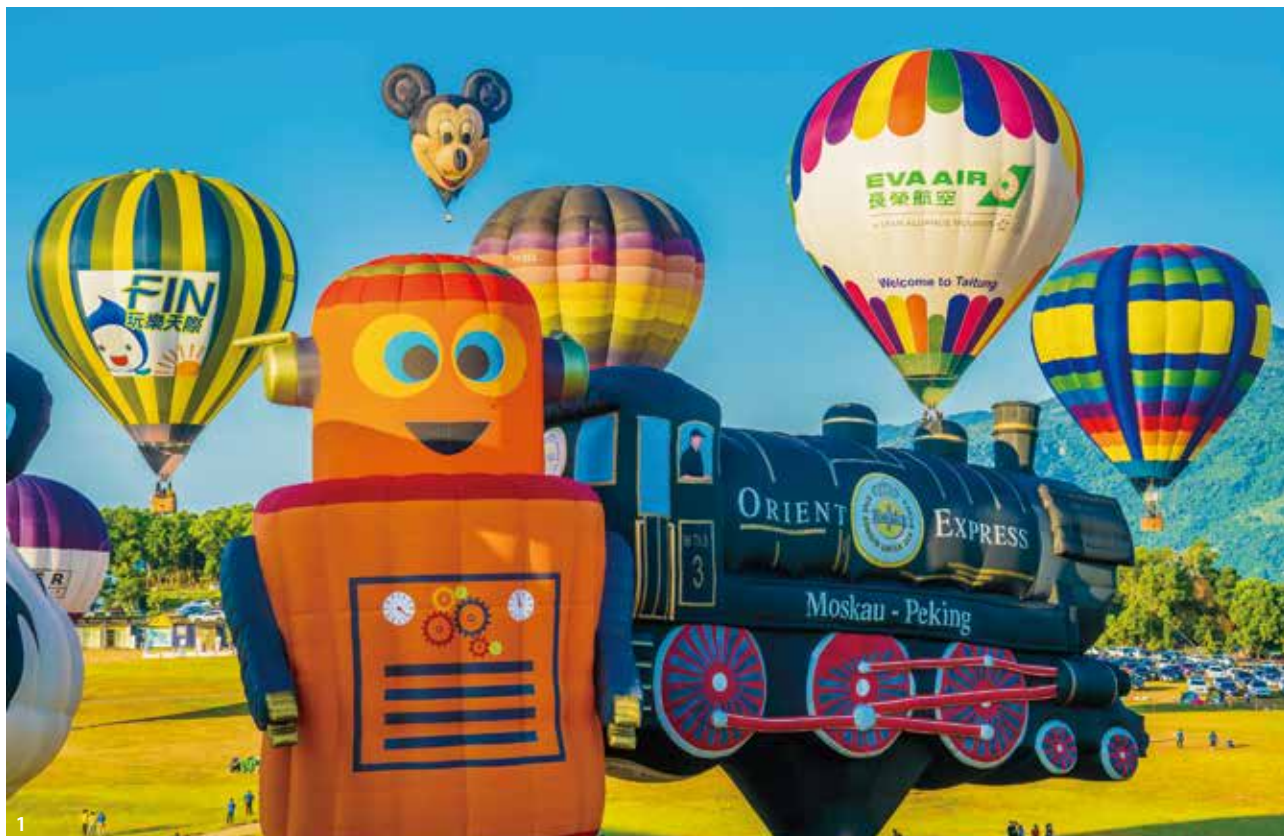
1.各種造型的熱氣球齊聚一堂。2.今年將舉辦9場光雕音樂會，為歷年最多的場次。

自從臺東舉辦熱氣球嘉年華活動以來，今年已堂堂邁入第9年。臺東縣長饒慶鈴表示，熱氣球嘉年華前8年，共計吸引了近600萬人次國內外觀光客湧入，臺東也因此躍上全球12大熱氣球驚豔城市的名單。因為舉辦的時間長、已經產業化等，對於帶動地方經濟發展成效卓著，儼然臺東最重要的年度盛會。