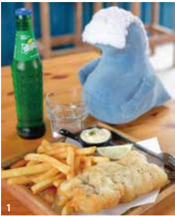
1.台灣號也有賣炸魚和薯條，頗受外國觀光客歡迎。2.日式烤糰子的外層刷上蜜香紅茶和蜜香綠茶，清新的茶香讓烤糰子有了臺東在地的味道。3.來到台灣號即能感受到都蘭的閒適。4.台灣號以創意冰品為主力。