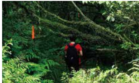
沿途路標並不明顯，建議可循登山前輩留下的布條來辨明正確前進方向。

站 在鹿堀坪古道的入口，地圖告示牌顯示有左右兩條路：向右是鹿堀坪古道，向左是鹿堀坪越嶺古道，兩條路程差不多，終點都是「大草原」；看起來可以從其中一條進、另一條出，完成一個環形路線。