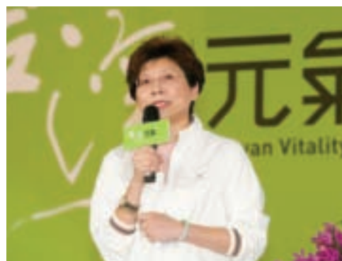
交通部觀光局賴瑟珍局長親臨致詞。

繼2008年的千人足健體驗挑戰金氏紀錄，今年的「2009經穴按摩體驗活動」多了幾分精緻和溫馨的感覺。台大綜合體育館聚集了來自日本、韓國、香港、馬來西亞等地的300多名國外旅客，在中華視障經穴按摩推廣協會的大力協助下，召集了來自全台各地的350名視障按摩師傅，共同為現場的國外旅客及佳賓們進行經穴按摩的體驗活動。