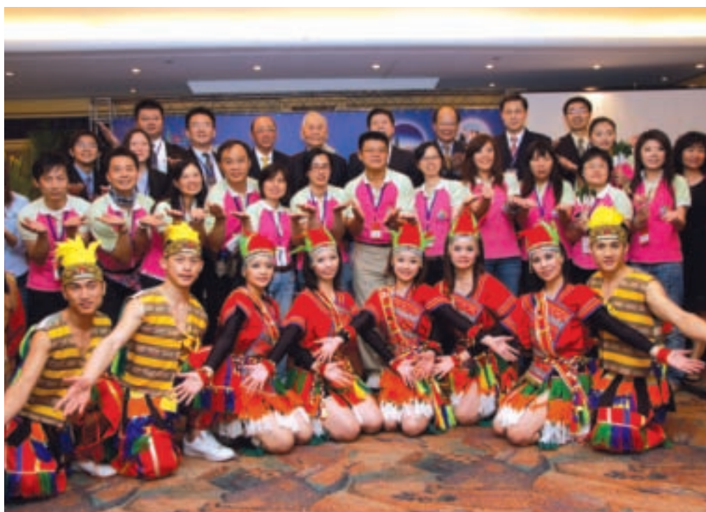
台灣代表團與澳門貴賓合照。

2008年港澳地區來台數達61萬人次，較2007年來台旅客人數49萬人次，於金融風暴中逆勢成長13.4%，僅次於日本地區，成為來台旅客第二名的地區。有鑒於港澳地區約有740萬人口，離台灣僅兩小時航程時間且語言相通，深具開發潛力，因此2007年本會組團參加香港國際旅展時，特地將推廣活動聯誼會延伸至澳門地區，藉由與當地業者及媒體餐敘，獲得雙方合作契機。2008年更進一步於澳門旅遊塔舉辦「台灣、澳門業者暨業者交流座談會」，藉由雙方業者與媒體相互討論及深度報導，增進澳門民衆對台灣之認識與了解，招徠其來台旅遊。今年則首次組團前往進行街頭展演，擴大推廣成效。