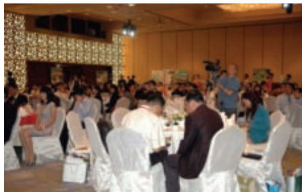
推廣會晚宴場面甚大，現場座無虛席並吸引媒體於現場採訪報導。

旅展期間爲充分展示台灣傳統文化，台灣館在設計中加入舞台元素，表演團體可以在台灣館的舞台進行表演造勢，十鼓擊樂團以精采的鼓樂教學吸引大批民眾前來參觀；魔術師則於現場表演精采魔術，並發送魔術道具進行教學，場面十分熱絡；紙雕老師現場與民眾互動摺紙，並於教學中融入台灣文化講說，使得新加坡民眾均驚嘆不已。