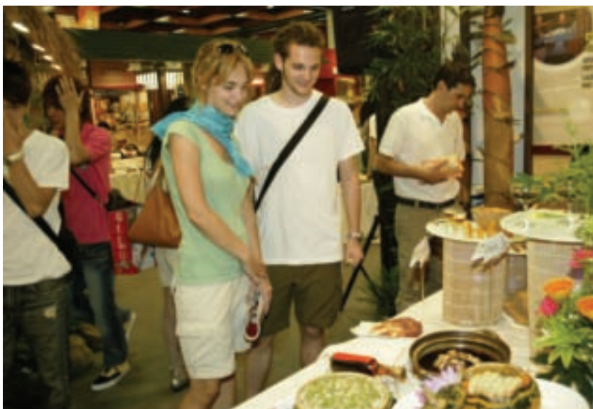
溫泉美膳館-外籍人士參觀

在亞洲頗具知名度的台灣美食展自1989年開展，今年邁入第20屆，美食展籌委會由時任交通部觀光局的毛治國局長所創立，原名為「台北中華美食展」，為配合觀光事業發展，自2007年改為「台灣美食展」，主題從早期單純的食材與料理，擴展到食器、文化與飲食氛圍，食藝文化結合名廚料理，各地特產食材結合成在地美食，風格愈來愈多樣，更啟發了無數美食界新血，也提升了廚師在台灣的专业形象及地位，並將台灣的餐飲產業推向國際化。今年滿20歲的美食展，將以「驚豔20！」做為策展主軸，於2009年8月20日至23日，在台北世貿一館A區盛大舉辦。