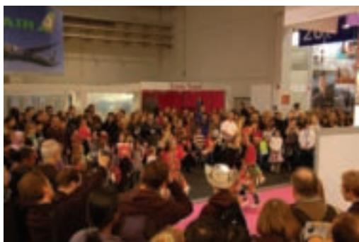
國民大戲班於柏林旅展台灣館中演出，吸引許多人駐足觀賞。