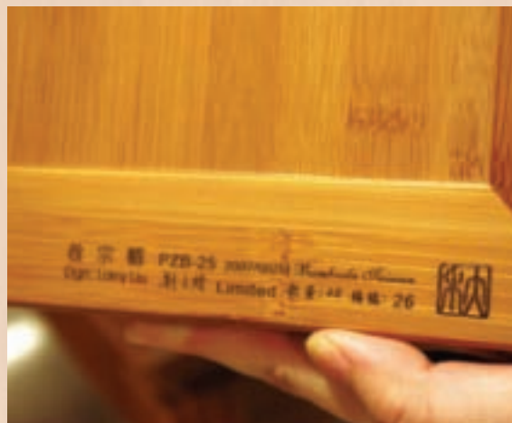
每種玄機盒都是限量發售，盒子底部或側邊都會註明發售數量和編號，只有持有人才知道如何開啓玄機盒。

突破傳統，大禾也積極開發不同以往的新產品，也與現代生活相結合，「竹製隨身碟」便是其中之一。透過傳統產業竹藝加工的方式與科技的結合，使用比塑膠更環保的竹材，不同以往塑膠或是金屬的峻冷感，取而代之的是溫暖的竹