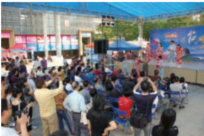
國民大戲班表演吸引眾多民衆觀賞。

會及交流晚會外，並邀請澳門主要旅行業者及台灣業者共同於友誼廣場辦理Road Show推廣會，使業者間有更多的時間交流討論，獲得熱烈迴響。