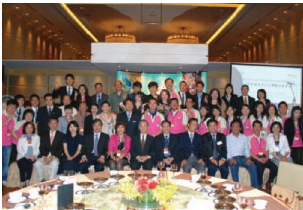
台灣觀光推廣代表團會後大合照。

台灣近年來在交通部觀光局主導及積極推動下，持續對東南亞觀光市場深耕推廣，拓展客源績效顯著， 2007年 馬來西亞來台旅客總人數大幅成長 22.66% ， 2008年 在全球一片不景氣中，仍達成了成長 10.24% 的亮眼成績，來台旅客人數突破 15萬 ，達到總人次 155,783 人，成為相當重要的客源市場。