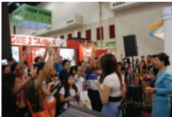
主持人介紹參展單位於小舞台進行有獎徵答活動。

在觀光局駐吉隆坡辦事處努力協調下，圖騰樂團於開幕典禮及展期間進行共7場次的表演，並透過專業主持人流利的中英雙語介紹與贈品吸引，鼓勵觀眾前往台灣展館，期間將各參展業者資料介紹予現場的群眾，獲得現場觀眾之熱烈參與及迴響。