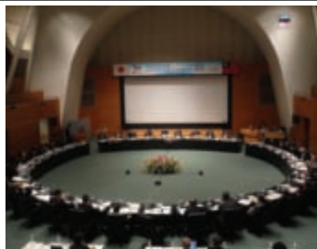
上圖/台日與會者於會場合影。 下圖/台日觀光界重量級人士均出席這場「圓桌會議」。

繼 2008年於台北圓山大飯店召開第一屆台日觀光高峰論壇之後，第二屆台日高峰論壇輪由日方主辦，假日本靜岡市市民活動中心盛大舉行，日本政府對於此次會議極為重視，大會前夕除靜岡縣石川嘉延知事特設宴款待我代表團成員外，並由於2008年10月成立之觀光廳次長神谷俊廣親自全程參與會議進行，我方駐日代表馮寄台、觀光局局長賴瑟珍及觀光局代表等相繼就雙方觀光議題溝通對話，為台日交流工作再度升溫。此次會議為自1973年台日斷交後，雙方政府觀光最高層級官員第一次會面，不但為台日觀光交流開啓新局，在我對日外交工作上亦可視為一大進展。