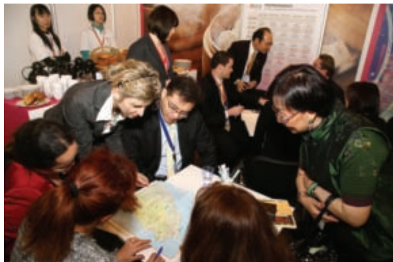
柏林旅展旅遊從業人員訓練課程中討論熱烈。

全部推廣活動在交通部觀光局指導、台灣觀光協會協同觀光局駐法蘭克福辦事處主辦、及國內旅遊業、旅館業、航空業之共同參與下，提供雙方業者面對面旅遊洽談，輔以高水準文化表演，以期歐洲民眾藉由觀賞台灣文化表演，品味台灣多元文化特色，更進一步成為其主要旅遊目的地，親自前往台灣觀光旅遊，體驗真台灣、發現新台灣。台灣觀光