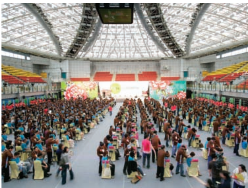
元氣PLUS！來自國外的300多名觀光客齊聚體驗台灣的養生保健按摩。

繼2008年的千人足健體驗挑戰金氏紀錄，今年的「2009經穴按摩體驗活動」多了幾分精緻和溫馨的感覺。台大綜合體育館聚集了來自日本、韓國、香港、馬來西亞等地的300多名國外旅客，在中華視障經穴按摩推廣協會的大力協助下，召集了來自全台各地的350名視障按摩師傅，共同為現場的國外旅客及佳賓們進行經穴按摩的體驗活動。