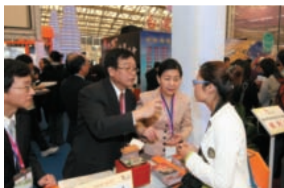
上圖/祖韻文化樂舞團以精彩的原住民歌舞演出，讓現場觀眾近距離體驗台灣豐富多元的魅力。