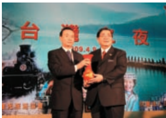
台灣之夜上，交通部觀光局郭蘇燦洋副局長與海旅會副秘書長范貴山互贈紀念品，象徵兩岸觀光交流愈來愈熱絡。

上海旅博會被視為中國境外旅遊風向球，隨著兩岸關係轉暖，陸客來台觀光大幅增加，交通部觀光局以台灣海峽兩岸觀光旅遊協會名義，整合各地方縣市、旅遊業者，首度參加上海旅博會，包括連江、金門、宜蘭、花蓮等四縣，皆設有展區推廣觀光旅遊。