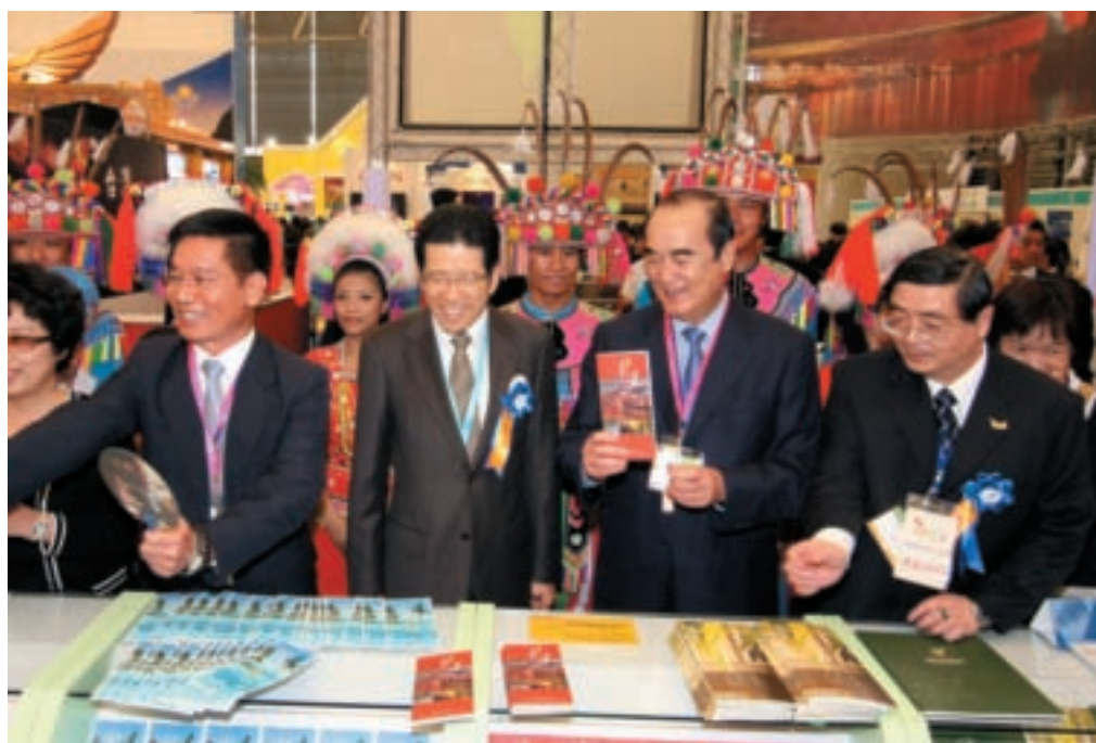
嚴團長(右三)及郭蘇副局長(右一)陪同花蓮縣謝深山縣長(右二)共同促銷台灣觀光。

交 通部觀光局首度以台灣海峽兩岸觀光旅遊協會（台旅會）名義，委外辦理大陸地區參展活動，首波推廣活動即瞄準大陸經濟發展最蓬勃的長三角經濟區，委託台灣觀光協會組團參加2009上海世界旅遊資源博覽會（World Travel Fair，簡稱WTF），該展自2004年起創辦至今年邁入第六屆，是目前大陸地區重要大型觀光旅遊展活動之一。