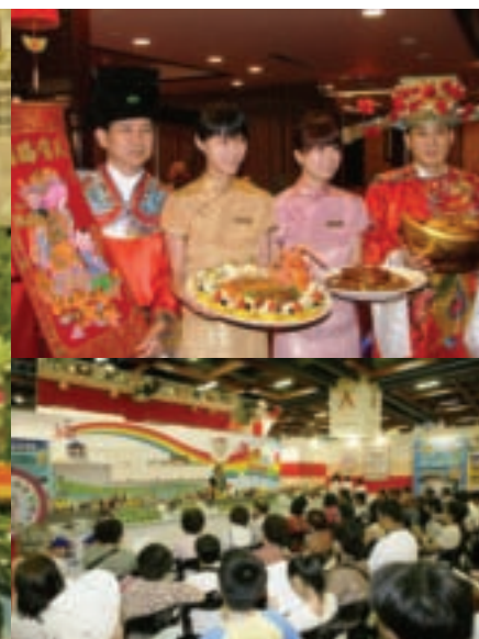
明星老師現場賣況