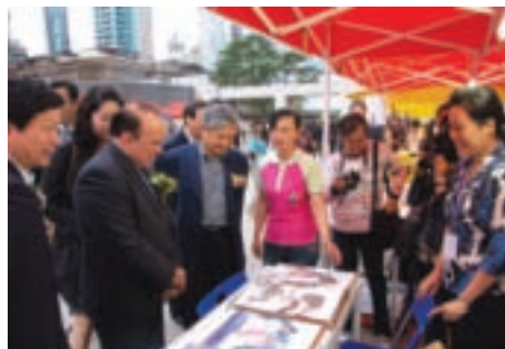
澳門旅遊局局長安棟樑參觀台灣攤位。

爲了加強於澳門地區宣傳台灣觀光，台灣觀光協會承交通部觀光局委託，組團赴澳門進行2009台灣觀光推廣活動。以往澳門推廣活動僅辦理一場聯誼活動，業者間的交流時間過短，無法針對業務方面進行更深層的討論，甚爲可惜，此次改變以往推廣形式，除辦理記者發佈