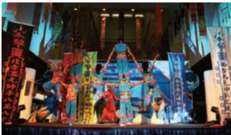
國民大戲班技藝精湛，於中央舞台時段演出，吸引大批民眾圍觀及熱烈掌聲。

推廣會中安排雙方業務洽談，讓當地業者更加了解台灣觀光資源。提供最新旅遊資訊，加強媒體與業者國際觀光交流，增進產品包裝行銷與推廣，積極拓展商機，達成觀光倍增計畫之成長目標。 台灣觀光