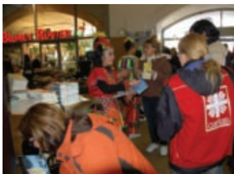
國民大戲班於亞歷山大廣場車站演出，民眾踴躍索取台灣文宣資料。

今年的柏林旅展參展單位，包含台灣在內共有來自187個國家的11,098個單位參展，參展單位數由2008年的11,147個下降至11,098個，主要原因在於德國參展單位減少211個單位，顯見德國國內旅遊業受全球經濟不景氣影響。雖全球旅遊業面臨艱難的形勢、歐洲地區觀光成長呈現停滯狀態，但危機也是轉機，正好是台灣政府與民間業者經營歐洲市場，提高台灣觀光在國際上的能見度的好時機，讓台灣有機會成為歐美人士前往亞洲旅遊的首要選項。