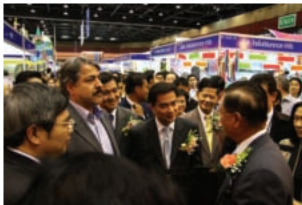
泰國總理阿披習( Abhisit Vejjajiva )及觀光體育部部長威拉薩·許素叻( Weerasak Khowsurat )等重要政府官員於開幕典禮後蒞臨台灣館，烏代表向總理介紹我國參展情形。

民俗藝人的才藝技能展現，一直都是展攤的要角之一，此次亦邀請作品曾獲國家工藝獎之民俗藝人余致潤老師，於台灣展館展示捏麵技巧。余老師以糯米粉混合麵粉，加上各種色料，以豐富的色彩捏出各種不同的作品，從俏皮的小精靈，到現代小朋友最喜愛的米老鼠、小叮噠、唐老鴨、皮卡丘等流行卡通人物及動物，色彩鮮豔、造型逗趣小巧，討人喜愛，受歡迎的程度讓往往一開展就有大排長龍，不僅豐富了展館的內容，也為台灣文化宣揚做了最好的見證。