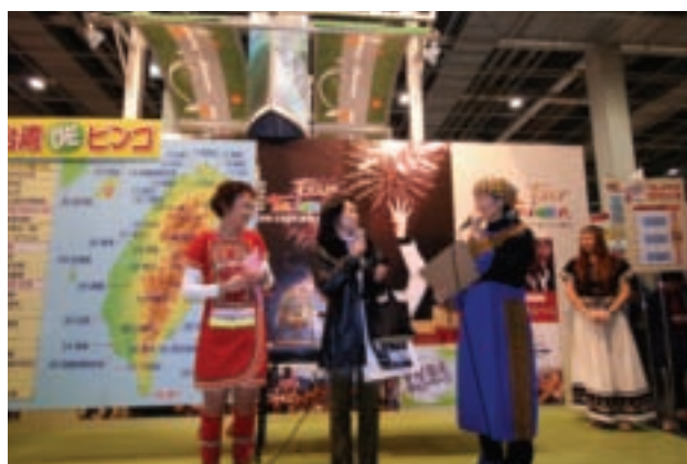
台灣賓果遊戲，藉由與現場民眾一起遊戲的方式來介紹台灣景點，娛樂性十足的宣傳手法受到好評。

廣島市為日本中國地區重要樞紐城市，是該地區760萬人口出入國的國際機場的所在，2004年本會