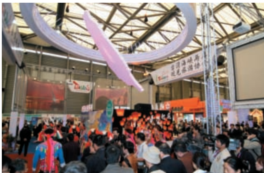
洽談會期間，台灣館湧入大批洽談業者及媒體人潮。