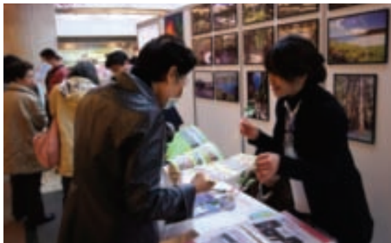
京都街頭展演的現場上，業者向當地民眾熱情介紹台灣觀光資訊。