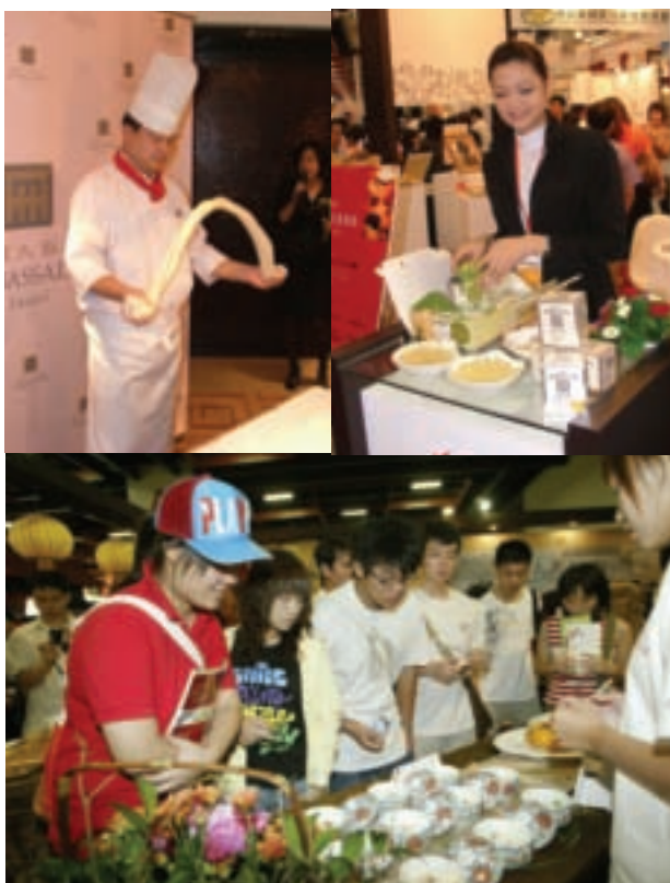
大明洪武宴-民眾觀菜

看大廚獻技，喜愛做菜、研究美味料理的婆婆媽媽也想要學一手嗎！美食節目中的明星老師要與大家面對面囉，美食展期間，名廚們親自輪番上陣，端出拿手絕活，傳授精湛廚藝給現場民眾，還有趣味的廚藝競賽、有獎問答等，有吃又有拿。 台灣觀光