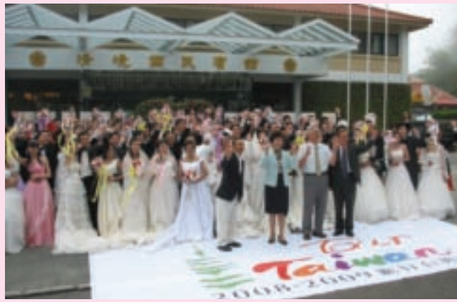
去年五月來自港、星、馬、日、韓等海外佳偶99對，於清境農場與台大梅峰山地農場，體驗高山浪漫的婚紗攝影。

作業流程，將從攝影到交件的過程大幅縮短，這是因為在這個顧客群中，外國觀光客多半是走少天數的行程，來台灣可能只有短短的三天兩夜或五天四夜，讓顧客能在回國時能一併帶著照片回去，是非常貼心的服務。再加上台灣在人像攝影上的技術，十分善於營造氣氛和造型變化，拍出來的照片和國外那種較生硬的人像攝影大大不同。更重要的是，在價格上，台灣攝影的價格又比國外廉價許多，自然能夠吸引許多人專程來台灣旅遊兼拍照了。