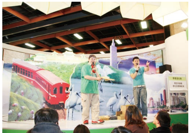
2007年ITF觀光局展攤，民眾與主持人互動熱絡

燈、台東炸寒單、台南鹽水蜂炮等，藉著一系列的宣傳，向國際推廣台灣觀光。其它創新的通路還包括捷運站、捷運車廂、公路跨橋、計程車車體等廣告，以交通運輸工具及大眾看板作為媒介，加強塑造台灣整體的觀光意象。