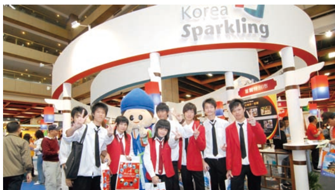
2007年ITF會場上韓國展攤表現亮眼，吸引大批民衆參觀

今年韓國觀光公社與韓國各相關單位組成26個展攤，於台北國際旅展現場，強力推廣韓國的旅遊魅力，展覽內容豐富多元，極具特色。