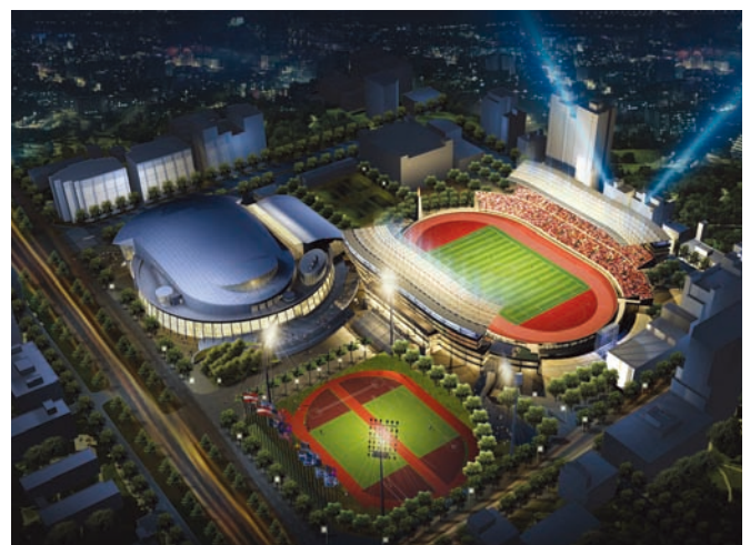
2009台北聽障奧運將於台北體育園區熱情引爆

除了硬體的規畫，為了展現「友善台北」，比賽期間將由85間學校分別作為每一個參賽國家的拉拉隊，除了幫忙加油，也協辦有關事務，讓選手感受台灣人的熱情。台北聽奧籌委會目前努力宣傳、廣招手語志工來服務明年的外賓，手語志工報名踴躍，預計志工與選手的比例可以達到一比一，讓選手們在面臨每天緊張的賽程時，也能感受台灣無微不至的接待與濃濃的人情味。