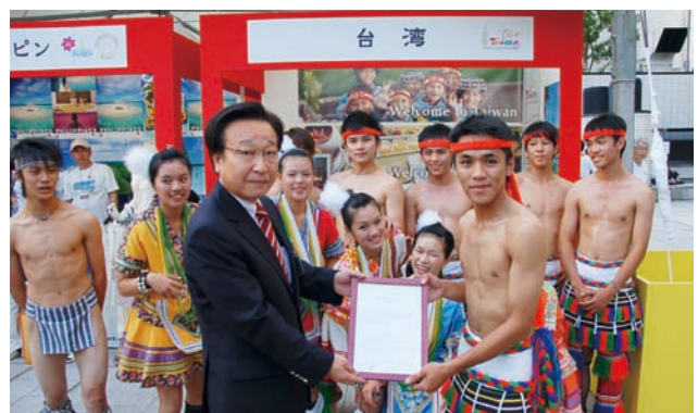
主辦單位福岡市政府觀光課課長致贈感謝牌給表演團體

市政府廣場舉辦，現場包含十個來自亞洲地區的國家共同參與，此外還有來自九州地區及日本各地的民眾共襄盛舉，是推廣台灣觀光的最佳場所。在Asia Pacific tourism promotion推廣期間，台灣攤位不斷發送最新台灣觀光情報與文宣品，另外在Coca-Cola Asia Pacific stage及其他會場都有展演機會，透過原住民表演加強對台印象，加強招徠台灣觀光旅遊。