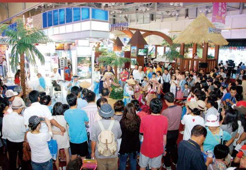
國民大戲班於台灣展館熱烈演出，吸引眾多民眾前來觀賞