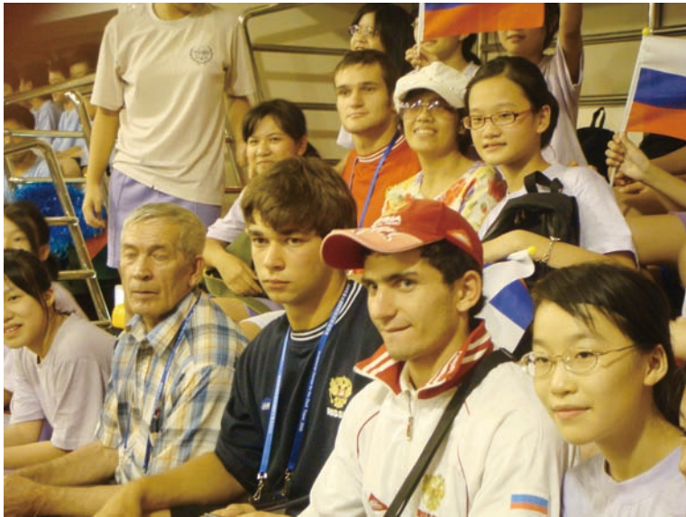
歷屆聽障奧運皆吸引許多國際旅客前往觀賽