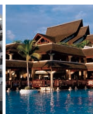
模里西斯帝王大酒店