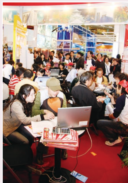
歷年ITF吸引眾多民眾前往了解最新旅遊資訊

台 北國際旅展(簡稱ITF)自1987年首度舉辦以來，進場參觀人數年年遞增，展場設施也越趨完備，可說是亞太地區最具國際級水準的大規模旅展和交易平台，亦是眾家業者每年不可錯過的盛會。展覽提供優質的旅遊產品資訊及各國精采的表演活動，吸引眾多人潮前往觀展，屢創佳績，去年(2007)已達19萬3,973的進場人次，今年更可望突破20萬人次，盛況空前，更使ITF成為媒體爭相報導的新聞焦點。