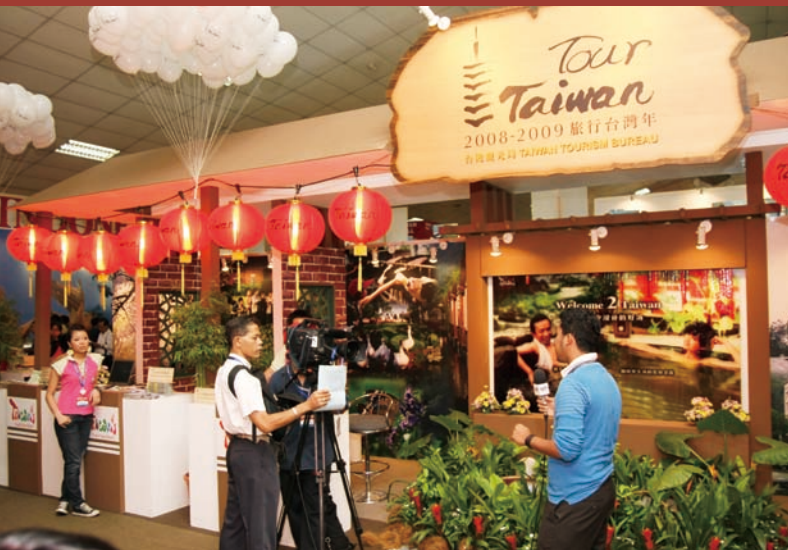
台灣館以九份老街作為設計概念，吸引大批民眾前往參觀