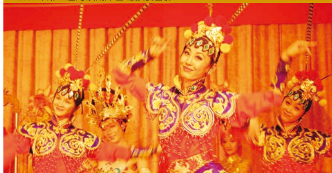
去年旅展期間獲得熱烈迴響的北京歌劇舞劇院今年也將再度演出