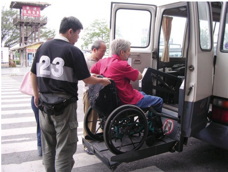
復康巴士讓殘障人士也能在台北旅遊無障礙