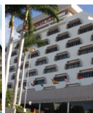
馬拿瓜皇冠廣場飯店