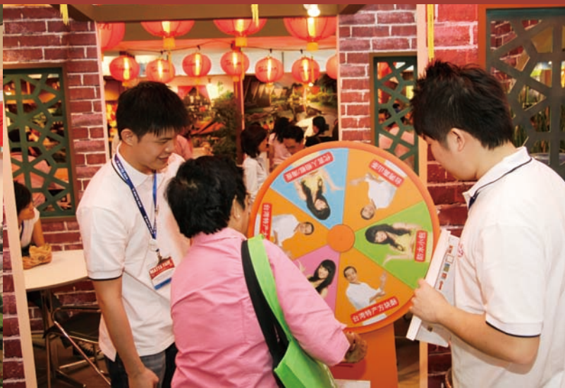
參觀民眾於台灣館進行飛鏢贈獎活動

馬來西亞觀光市場是台灣近年來積極推廣的重點，深耕之下已有顯著成效。2008上半年度馬來西亞訪台旅客人數穩定成長8.35%，目前已成爲我國主要客源地之一。配合觀光局「2008-2009 旅行台灣年」，政府單位及民間觀光業者組團參加2008秋季馬來西亞MATTA國際旅展，跨海加強宣傳台灣觀光。