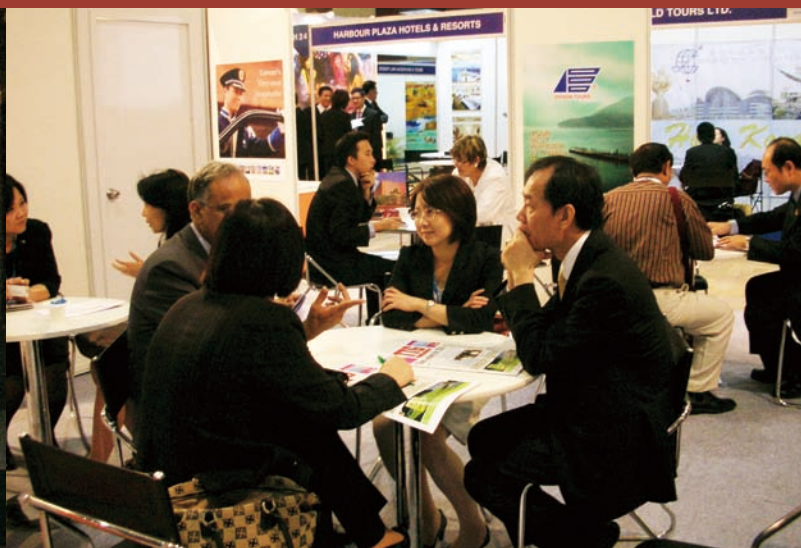
交易會會場吸引許多觀光產業人士前往洽談，反應熱烈

「2008-2009旅行台灣年」旨在拓展世界各地來台觀光客源，地處南亞的印度，被視為極具開發潛力的新興客源市場，也是政府的全球重點開發市場之一。台灣觀光協會受交通部觀光局委託，今年繼續組團赴印度辦理推廣活動，有助於達成整體觀光成長目標。