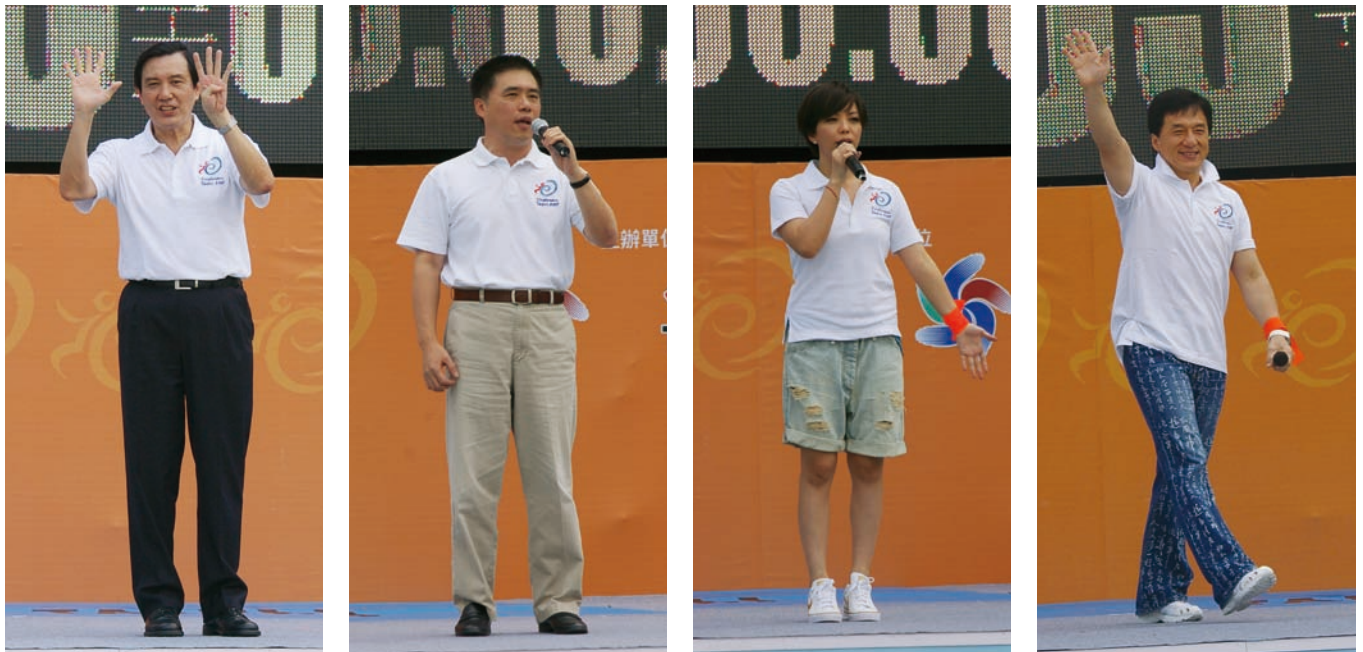
響應2009台北聽障奧運，總統馬英九、台北市長郝龍斌、2009台北聽障奧運代言人張惠妹、2009台北聽障奧運形象大使成龍(由左至右)皆熱情參與