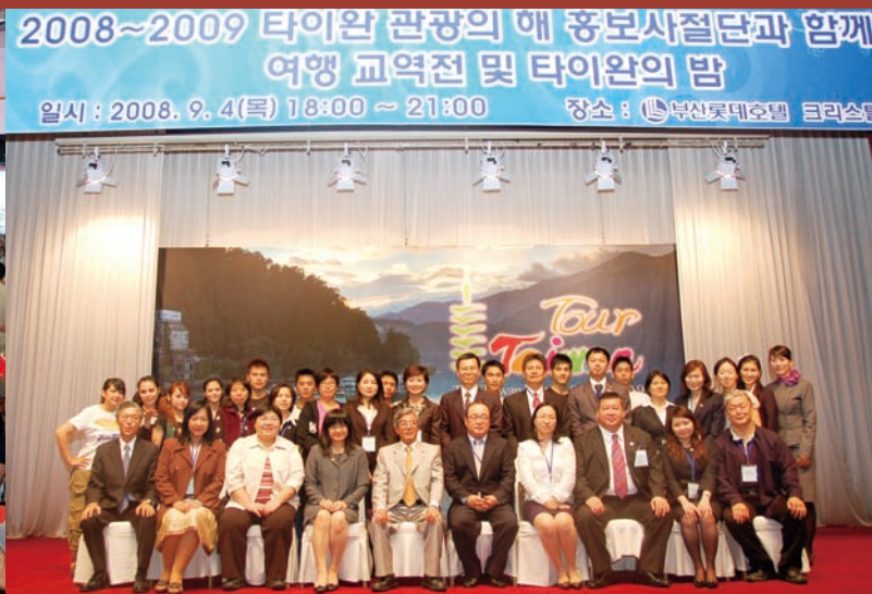
代表團團員於台灣之夜後合影

近年國內韓流風盛行，不過您可能不知道，韓國旅客來台觀光旅行，也正呈直線成長，蔚為風潮。據交通部觀光局統計，今年上半年來台旅客計191萬2,611人，較去年成長5.55%，其中以韓國旅客成長率達32.7%，共有15萬1,282人來台，表現最為亮麗，預估今年韓國旅客可望突破30萬人！