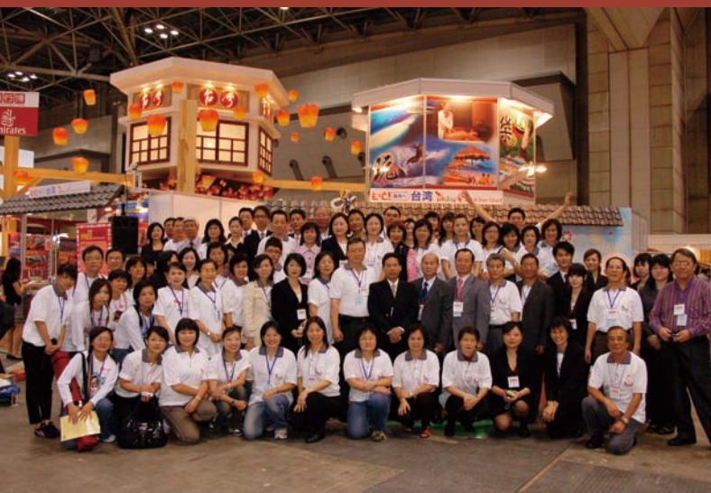
2008東京旅展台灣觀光代表團團員於台灣展館前合影