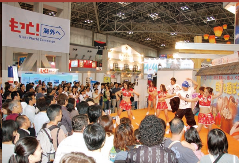
此次表演團體於台灣展館舞台熱烈表演，吸引眾多日本民眾圍觀

前往台灣旅遊一向受日本旅客喜愛，統計顯示，日本旅客位居我國觀光客源之首，為進一步宣揚台灣旅遊的優勢，同時並配合98年3月日本靜岡縣「富士山靜岡空港」之啓用，我代表團主動出擊，參加2008年東京世界旅遊博覽會，並順道前往靜岡縣，舉辦街頭展演，以未來台北→靜岡間飛航時間大為縮短為訴求，積極對當地民眾展開宣傳，行銷台灣觀光。