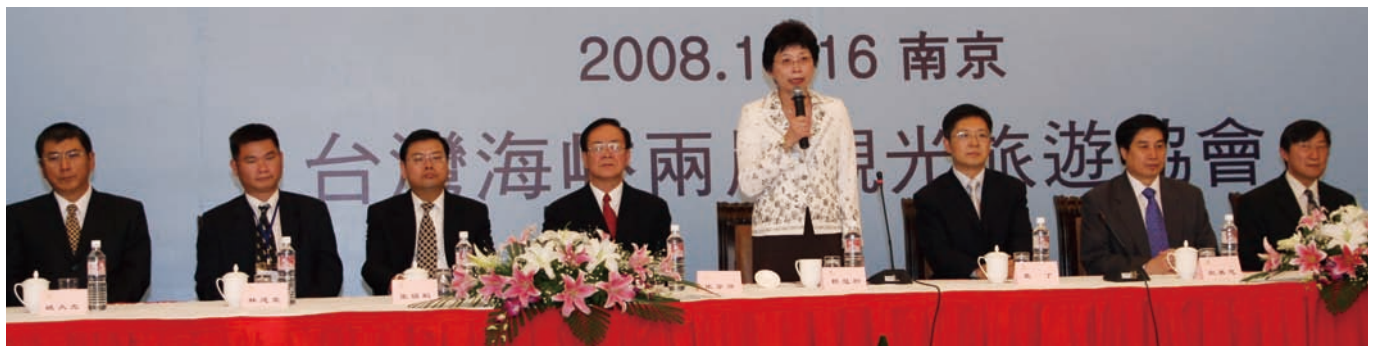
推廣代表團於台灣觀光旅遊說明會上積極宣傳近日針對陸客入台申請手續的各項簡化措施，增加陸客來台旅遊意願

隨著大陸出國觀光人數的遽增及消費力的提升，大陸觀光客已成為各國發展觀光競相爭取的主要客源之一，各國紛紛前往大陸地區辦理推廣行銷活動、參與旅展以招攬客源。兩岸長期特殊的政治關係以及台灣各方面快速發展之成就，讓大陸人民對台灣產生極大的好奇心，觀光旅遊開放之後，許多人都有興趣前來台灣觀光，進一步認識台灣。有鑑於此，觀光局積極整合公私部門觀光產業資源，並透過民間長期建立的友好基礎，努力提升陸客來台旅遊人數，希望為台灣觀光業帶來商機，創造雙方旅遊業雙贏利益。此次觀光局主辦的大陸推廣活動，成功引起大陸民眾對赴台旅遊議題之關注，並提升大陸旅遊業者對台灣整體接待環境之認識。觀光局首度前進大陸辦理說明會，成果豐碩，獲得兩岸旅遊業者一致肯定，盼未來有更多推廣活動，有助拓展大陸觀光客源。