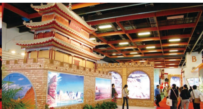
2007年第二屆海峽兩岸台北旅展壯觀的展場佈置