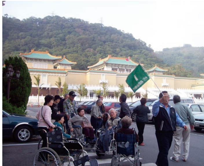
故宮博物院設有無障礙設施，讓殘障人士參觀時更便利