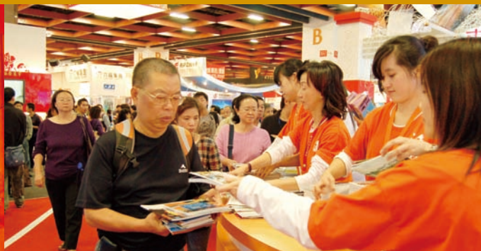
2007年第二屆海峽兩岸台北旅展期間民眾熱情索取旅遊資訊

到昆明市參與中國國家旅遊局、民航總局與雲南省政府合辦的中國國際旅遊交易會，開啓兩岸觀光交流的新局。儘管當時還沒開放通航，但是對於日後陸客來台著實打下了深厚基礎。而今年中國國際旅交會將在11月20至23日於上海市舉辦，協會也會組團參與，並擴大規模將參展攤位增至86個。