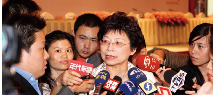
交通部觀光局賴瑟珍局長以台旅會會長身分率團至大陸舉辦旅遊說明會，深受雙方媒體關注

觀光局此次號召觀光相關協會成員及63家核准接待大陸旅客之旅行社代表約150人組成台灣旅遊觀光推廣代表團，前往北京、南京兩地辦理台灣旅遊觀光說明會。會中由觀光局國際組劉喜臨組長代表進行台灣旅遊資源簡報，除傳統環島行程，短天數、高品質、深度體驗旅遊亦為推廣重點，此外更加強宣傳近日針對陸客入台申請手續的各項簡化措施，以增加陸客來台旅遊意願。會中台灣旅行業品質保障協會(品保協會)也就台灣旅行購物保障制度及品保合格標章產品提出簡報，希望藉由推行品保制度提高旅遊品質，保障旅遊消費者權益。