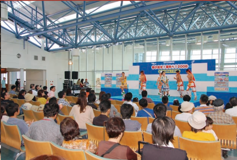
表演團體於福岡空港進行展演

配合觀光局推動2008-2009旅行台灣年工作計劃，加強國際宣傳推廣，台灣觀光協會特邀請本土特色表演團體，一同前往日本參加福岡亞洲祭活動，赴海外加強推廣台灣特色觀光景點，招攬該地區旅客來台觀光旅遊，促進我國觀光事業蓬勃發展。