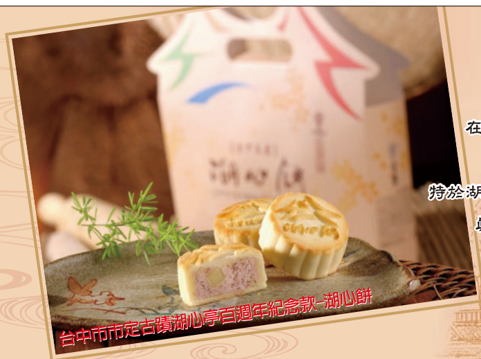
台中市市定古蹟湖心亭百週年紀念款-湖心餅

2008台北國際旅展與伊甸社會福利基金會，於ITF會場共同設置伊甸攤位，服務身心障礙民眾，更提供伊甸復康巴士免費接駁