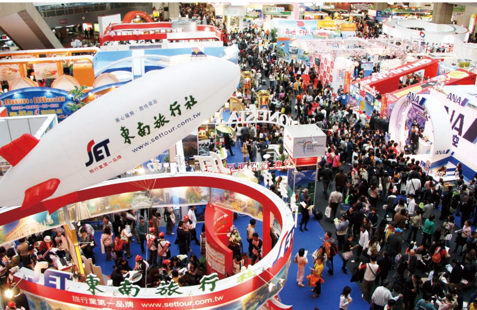
2007台北國際旅展創下19萬3,973的進場人次，今年ITF預計突破20萬人次，打破新紀錄

由台灣觀光協會主辦的第22屆台北國際旅展(Taipei International Travel Fair, ITF 2008)將於台北世貿展覽館一館隆重舉行，展出期間從10月31日(週五)到11月3日(週一)，總共四天。今年有62個國家及地區參與展出，攤位多達1,206個，規模更勝以往！歡迎對旅遊產品有興趣的朋友前往共襄盛舉！