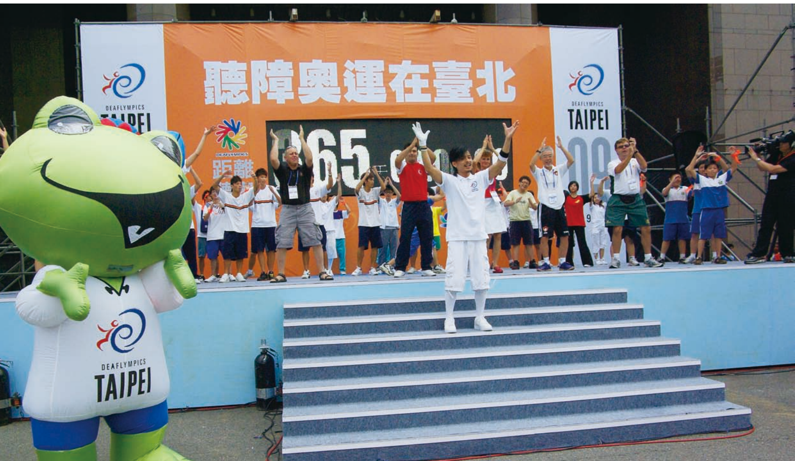
為迎接2009年台北聽障奧運，一系列暖身活動已提前開