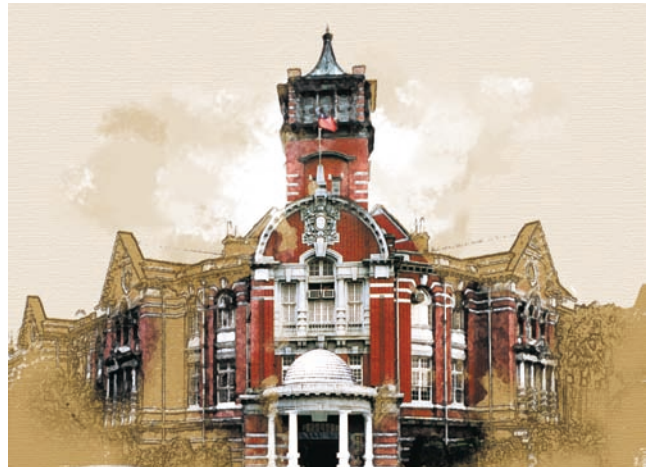
台灣菸酒公司總公司

台灣菸酒公司首度設攤參與今年的ITF台北國際旅展，攤位現場將展示各觀光酒廠出產之特色商品，並提供民眾品評試飲，亦有專人為消費者進行簡易的觀光導覽及酒品介紹，讓民眾可以更加深入了解台灣菸