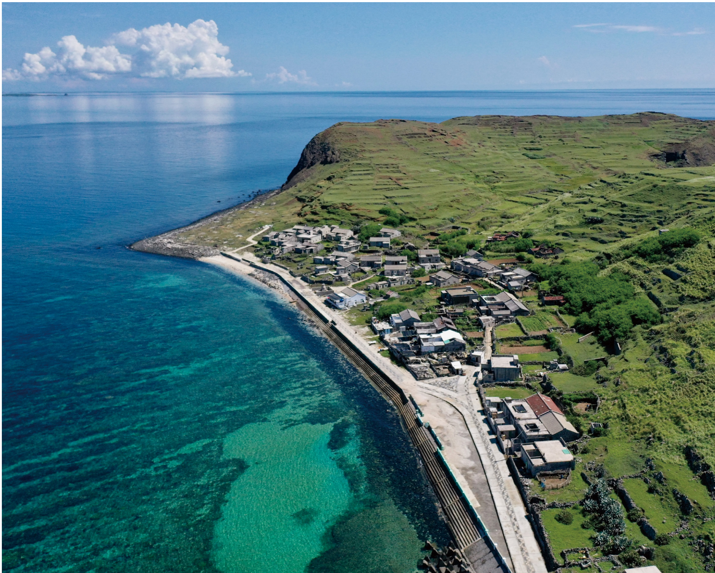
東嶼坪聚落群前的海中有廣大的珊瑚礁群

穿梭範圍廣大的傾頽石牆，常會找不到前行的方向，因此在坪頂之上，特別採借澎湖當地常見的鎮風石塔的風土建築形式，以砌石在遼闊的地平線上，於步道轉彎處豎立石堆，只要跟著石堆，就可以看見下一個石堆，順利經過金龍塔回到聚落，當你這樣跟著石堆循跡的時候，就像希臘神話中帶著公主的毛線球從米諾斯迷宮中順利離開的忒修斯，而東嶼坪的山海之景，像極了愛琴海上的島嶼。