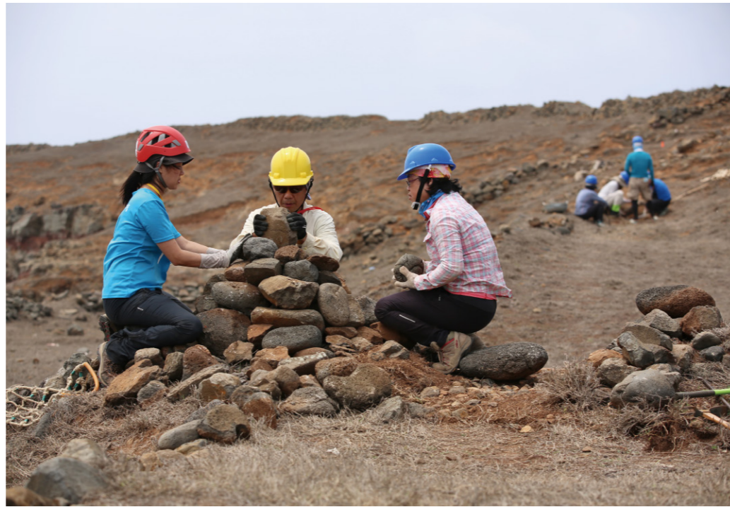
步道志工堆置指引方向的石堆