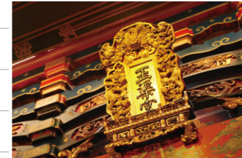
車埕的角頭廟——玉渠宮。