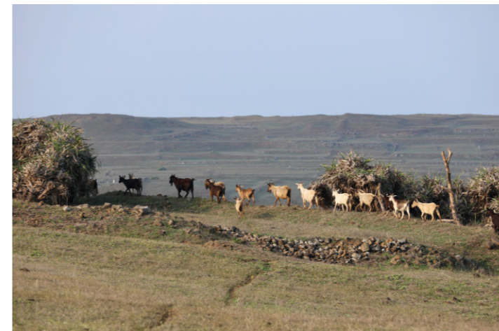
羊群穿梭在高地砌石間