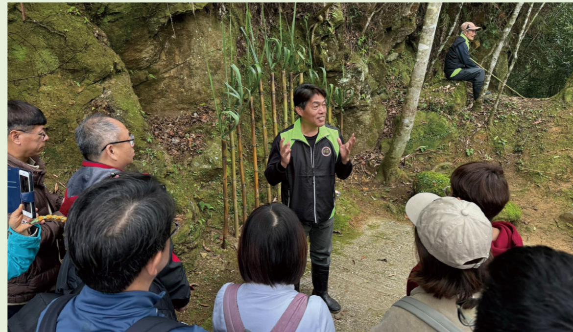
賽夏族根誌優長老講述原住民族文化