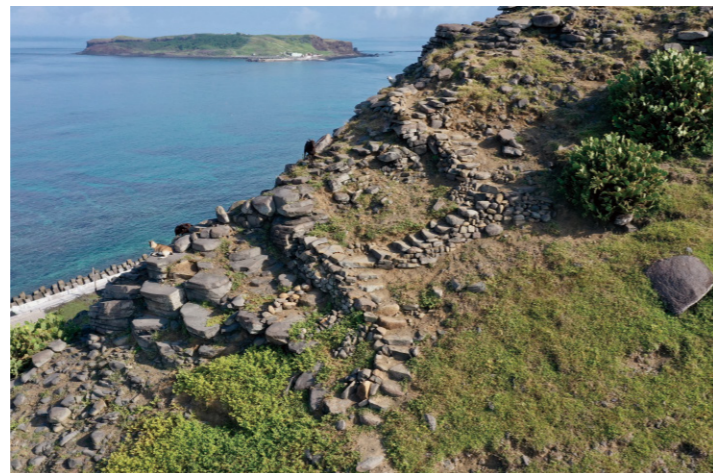
經過手作步道修築的之字形路線已清晰好走