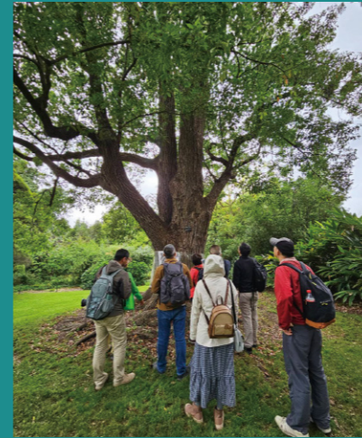
澳洲森林療癒體驗