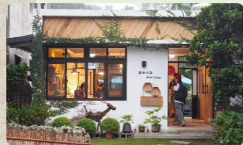
森林小站