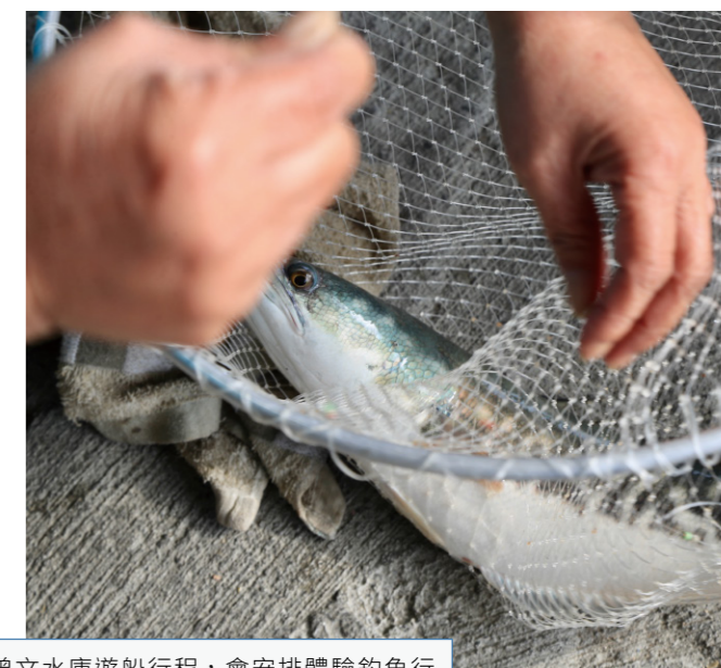
曾文水庫遊船行程，會安排體驗釣魚行程，水庫魚多，很容易有小魚上鉤