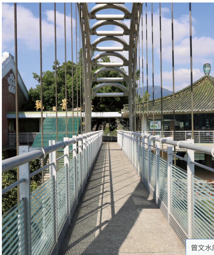
曾文水庫觀景台，是俯瞰水庫最佳景點