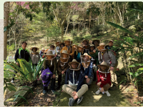
林下養蜂體驗活動