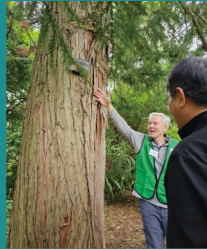
澳洲森林療癒與樹對話