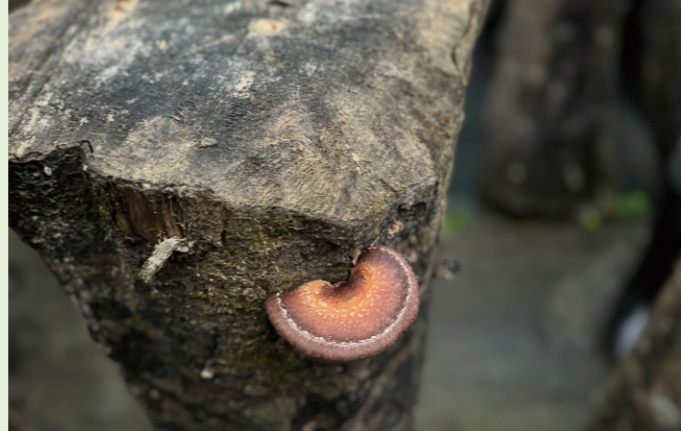
段木香菇

在林業保育署與賽夏族人的合作下，除了守護賽夏秘境的生態外，更延伸至與自然共存的永續林場經營與林下經濟，共同打造一個生態平衡與多樣性共生的理想。