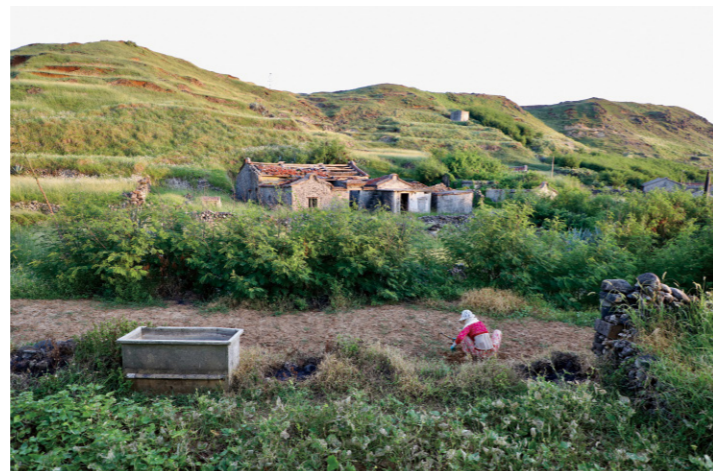
島上仍可見舊建築與居民生活情景