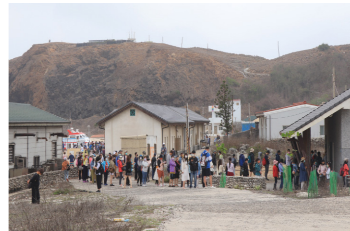
暴量遊客人潮造成島嶼衝擊

南、北兩座方山，一般來說稱南方的高地為前山，北方則為後山，島嶼僅約48公頃的面積狹窄，方山更顯拔地而起的陡峭，在方山之間的山坳谷地稱為沙溝仔，在沒有河流的小島上，山谷低地是重要的地表水匯聚之處，島上聚落建築群主要集中在島嶼西側窄長的濱海低地，北起山谷出口螺仔角附近，南迄島西南側漁港附近。