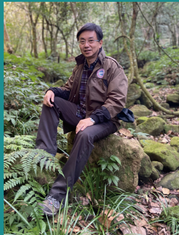
林業保育署林華慶署長於賽夏族秘境

森林療癒亦可促進林地活化與多元運用，山村、部落社區居民尤其適合擔任森林療癒師，除了能運用最熟悉的自有與週邊林地規劃作為森林療