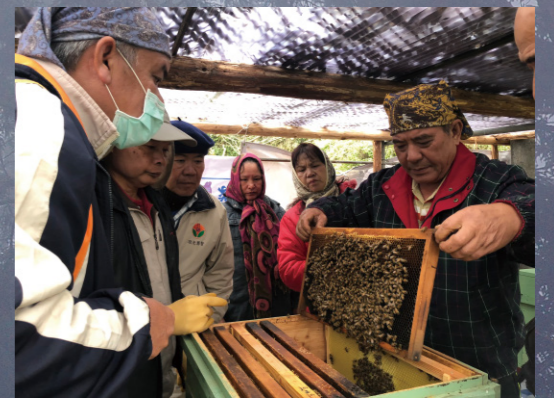
養蜂成為蓬萊部落發展林下經濟的基礎