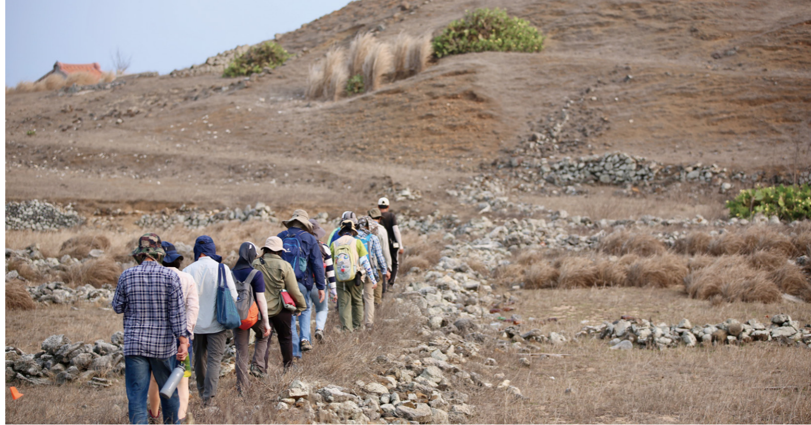
「風林」是東吉嶼的特色景觀

2020年當我首次登島，船隻進港的時候，首先映入眼簾的是一座形似關公的小丘，在港口正前方突起一座小方山，東嶼坪嶼從海上看似平坦，但島上海拔61公尺的後山為南方四島中的最高峰。島形狹長，有