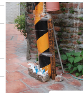
金盛巷電線桿旁的竹符。

很簡單的一趟下角散步，但我們已經走過一段港鎮的歷史，也在這樣的路徑上穿梭進在地生活的各種面貌。徐徐的風吹來，我們崇敬這座古老的城鎮，在這裡，也找回了自己。●