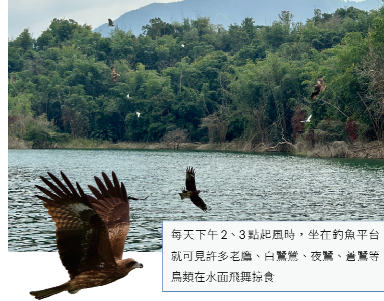
每天下午2、3點起風時，坐在釣魚平台就可見許多老鷹、白鷺鷥、夜鷺、蒼鷺等鳥類在水面飛舞掠食

烏山頭水庫最讓人嘖嘖稱奇是它只靠著58公尺的高低水平落差，就讓嘉南大圳的灌溉水源在沒有任何機械動力情況下往前奔流1萬6千公里，相當於繞了地球1/3圈，且使用至今100年依舊順暢，是極富世界遺產潛力的水利工程。但這系統因為烏山頭水庫蓄水量僅8千萬噸，就像一支電池容量不高的手機，而曾文水庫角色就是一個超大容量的行動電源，隨時支援。