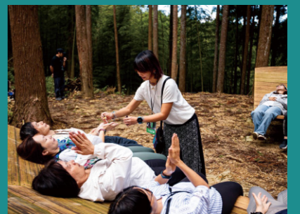
精油基礎認知體驗