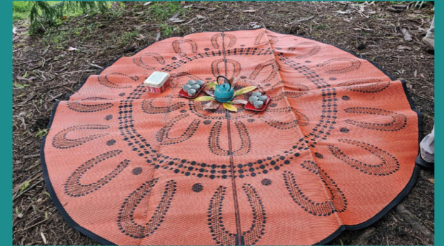
澳洲森林療癒心靈感受坐墊