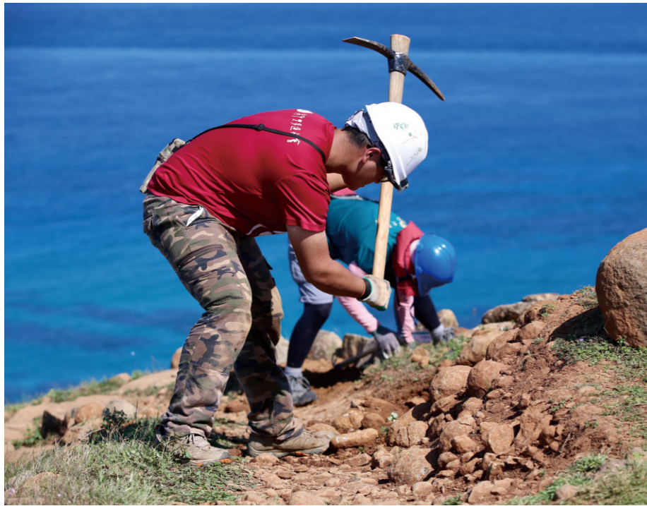
近年南方四島採取永續、低衝擊的「手作步道」作為維護路徑的方法