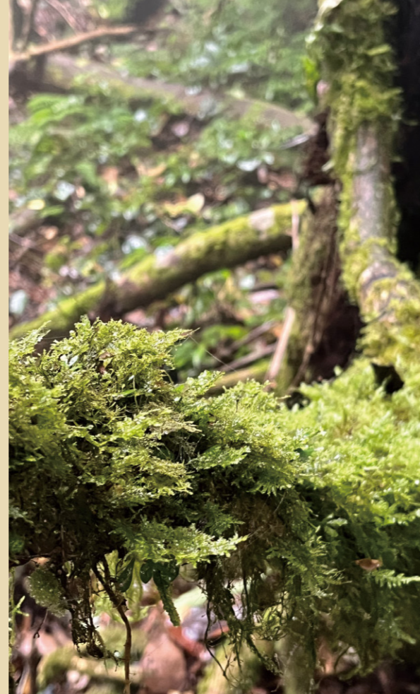
秘境中的苔蘚

走著走著，我們來到了森林深處的河谷，這裡有一棵被視為精神象徵的百年老樹猴歡喜。長老告訴我們，當年因為有位男孩破壞規矩，晚上偷偷跑到山林裡打獵，誤射山神徒弟，因此被山神懲罰收為徒弟，並固定他的雙腳，漸漸地，男孩變成了一棵大樹。此後，族人進入森林打獵或採集時，總會帶著食物來探望，說要去看爸爸、和爸爸聊聊天，因此又被稱為爸爸樹。